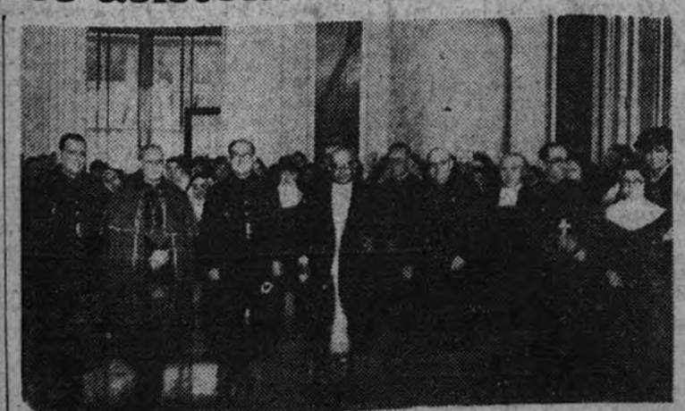
El Ministro de Educación Nacional, con el Obispo de Madrid-Alcalá, en los actos de clausura.

Se terminó la Primera Reunión Nacional de Colegios de Enseñanza Media regidos por religiosos, que se celebró en la capilla del Colegio del Sagrado Corazón de Madrid-Alcalá, por los representantes de los Colegios de Enseñanza Media regidos por religiosos de España. El Sr. Ministro de Educación Nacional, el Sr. Obispo de Madrid-Alcalá y el Sr. Delegado Nacional de Enseñanza Media, asistieron a la reunión y a la terminada asamblea.