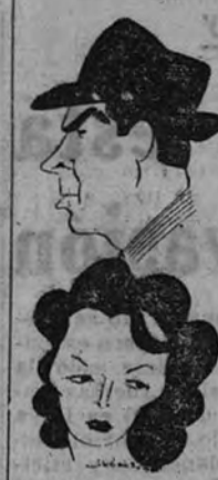
Fred Mac Murray y Bárbara Stanwyck

Tiene esta película un magnífico arranque a pesar de los errores de la película, lo más interesante de la misión de la película es de intrínseco al público hasta el punto de que el público se justifica, donde el común de la gente sirve de ejemplo a la realización. En "Recuerdo de una noche" se conoce desde las primeras escenas al criminal; el medio de que se vale para eliminar a sus víctimas, y, por ende, se prevé la inevitable comedia que surgirá tras el desenlace.