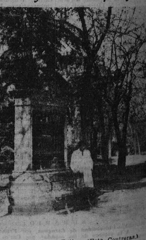
Una biblioteca popular en el Retiro.

Son los «bibliotecarios» de estas bibliotecas de nuestros jardines y parques matritenses viejos y humildes jardineros. En una silla, junto a su biblioteca, toman el sol y aguardan la llegada de los lectores para que, una vez hecha la papeleta, les sirvan lo pedido y luego les vigilen—bien que no sea necesario—desde su puesto de fieles vigías. Humildes hombres llenos de amor a sus bibliotecas y al jardín en que éstas se levantan y que tantos años cuidaron. En la Casa de Fieras cuida de la misma un muy viejo actor que en días le-