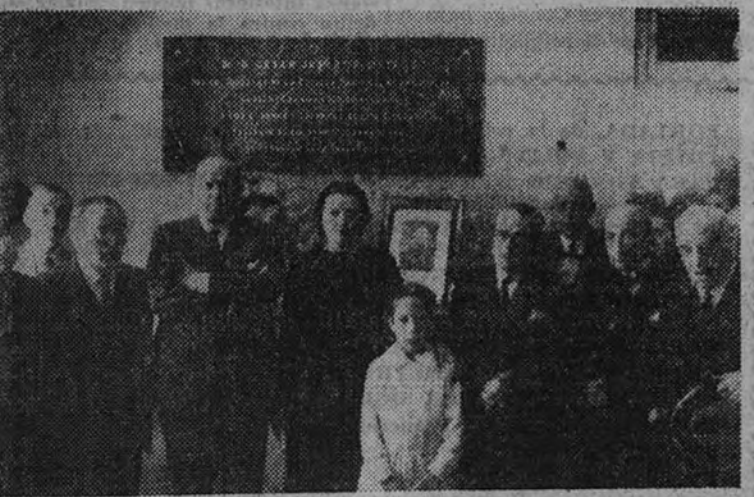
El director general de Primera Enseñanza en el acto de descubrir la lápida a la memoria del doctor Juarros.

El director de Primera Enseñanza verificó el descubrimiento