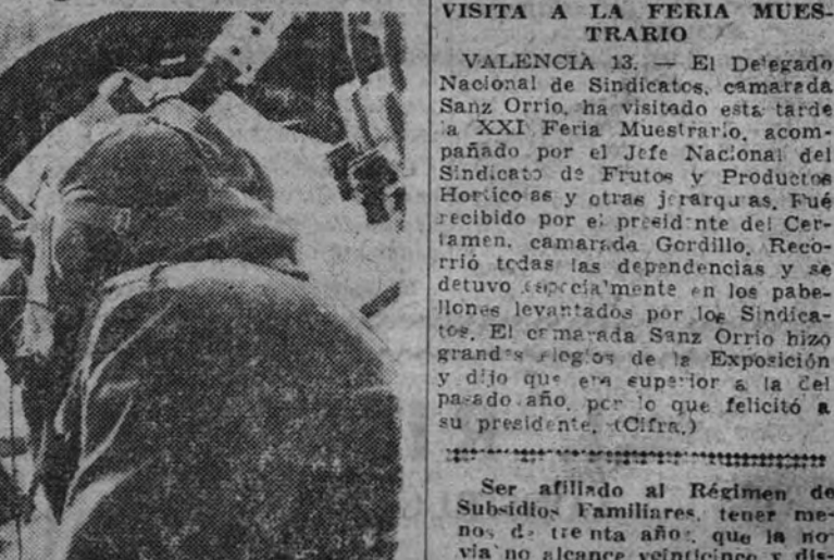
El observador de un avión húngaro de guerra estudia y vigila atentamente el movimiento de las columnas enemigas.