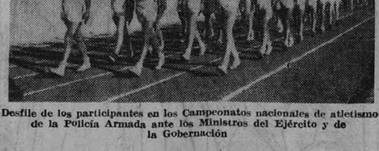
Desfile de los participantes en los Campeonatos nacionales de atletismo de la Policía Armada ante los Ministros del Ejército y de la Gobernación

Las alineaciones de los equipos madrileños