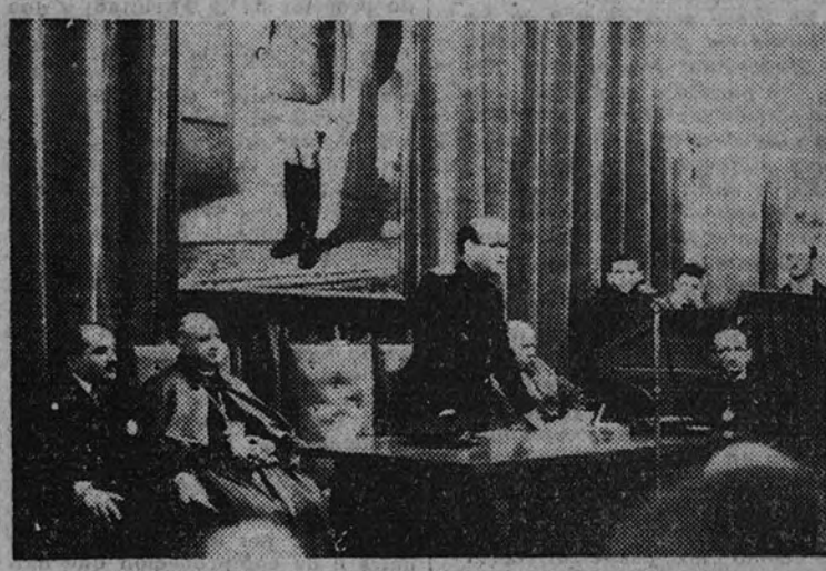
El Ministro de Educación Nacional, en su discurso

BUENOS AIRES 17. — La Comisión de Museos y Monumentos ha acordado colocar en la base del monumento al Cid Campeador —donado en 1935 por su autora, Ana de Huntington— la siguiente inscripción: «Encarnación del heroísmo y espíritu caballeresco de la raza». (Efe.)