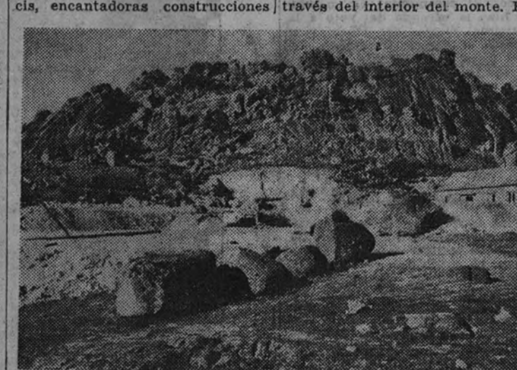
Una vista exterior de las obras

Hace unos días, sobre la maravilla del viaducto Martín Gil, en el embalse del Esla, el Caudillo dijo: «No soy amigo de primeras piedras; quiero ver obras terminadas».