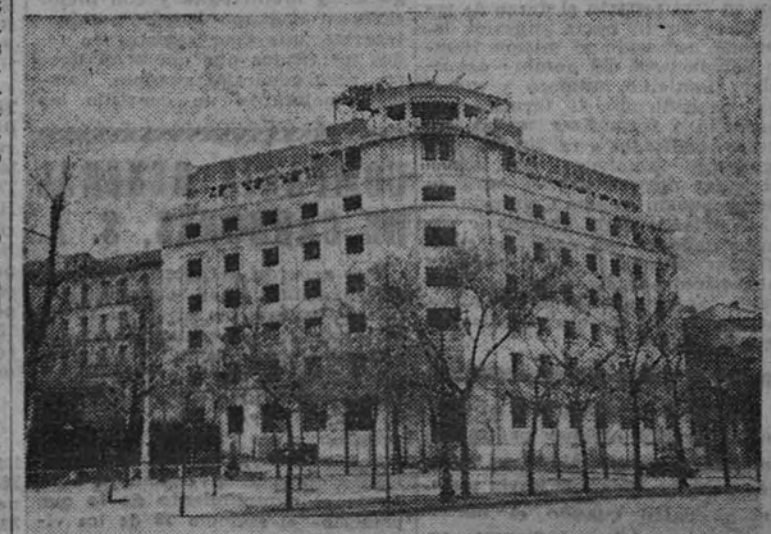
Edificio de la Unión Española de Explosivos, en construcción

Bloques de viviendas construidas en el barrio marítimo del Grao por Regiones Devastadas