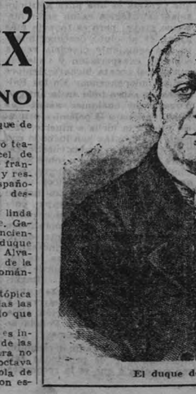
El duque de Rivas

caja fortuna sobre el pecho del padre de Leonor. Recuerda muchísimo la escena novena del acto segundo de "La verdad sospechosa". En la obra de Ruiz de Alarcón, don García nos cuenta en romance cómo estando en la habitación de la amada fue sorprendido por el pa-