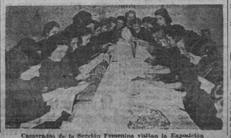
Camaradas de la Sección Femenina visitan la Exposición

MEXICO 22.—El rasgo del altruismo español Muñoz Carbó, industrial de este país, que ha regalado un millón de pesos a la Beneficencia española, motiva elogiados artículos de prensa para la gran obra benéfica fundada el siglo pasado por el conde de España Nieto. (Efe.)