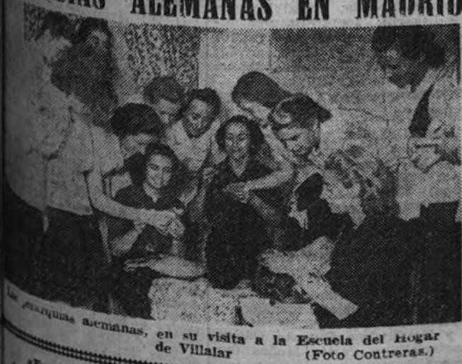
Barquillas alemanas, en su visita a la Escuela del Hogar de Villalar.

Entre todos los principios morales en que se basa nuestra doctrina campea en primera fila el de la justicia, que hará que todos los hombres sean un poco más felices, y presuponiendo en todos los hombres la voluntad de mejorar habrá muchos menos pobres, aunque unos pocos sean algo menos ricos. (Del discurso del Caudillo en Málaga.)