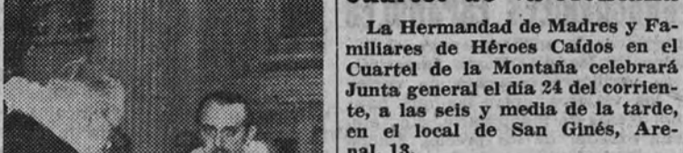
Investidura de los nuevos caballeros.

En la tarde de ayer se reunió el Capítulo de la Orden Militar de San Lázaro de Jerusalén en el templo del Real Monasterio de la Encarnación, con motivo del cruzamiento de nuevos caballeros de Justicia.