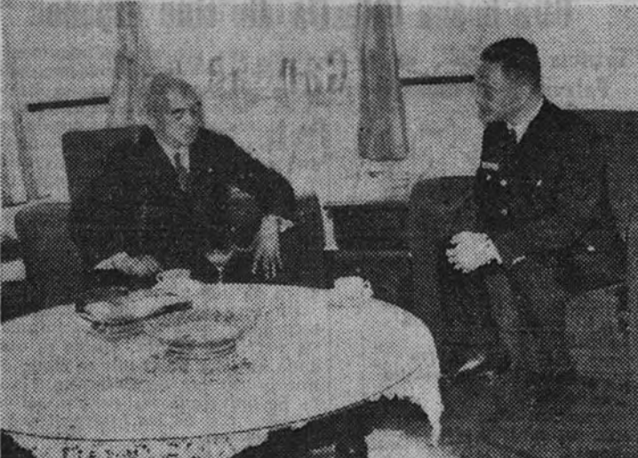
Wan-Chin-Wel, jefe del Gobierno nacional chino, conferencia con el consejero Sotaro Lohiwatari sobre la organización militar de las fuerzas nacionales.