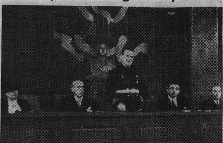
El director general de Sanidad en el discurso inaugural de una de las sesiones