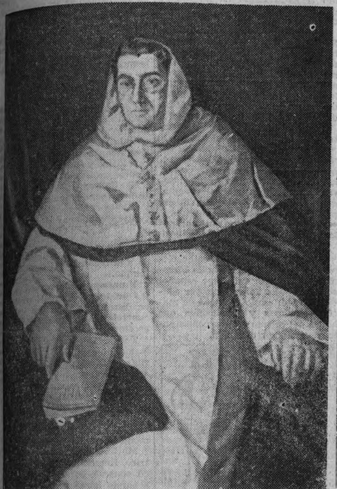
El padre Sancho, Rector Magnífico de la Universidad de Manila; cuadro, por Vázquez Díaz.

Se ha querido por el Jurado de la Exposición Nacional—sin duda como alegato de perdón para sus muchas culpas de error, torpeza, y no bien intencionado propósito en la admisión, y sobre todo, colocación de obras—hubiera una sala consagrada a la pintura religiosa. Con indiscutible desacuerdo, por creer que basta la identidad temática para unir en poco espacio los más antagónicos estilos, los más dispares conceptos estéticos y las más dafinas promiscuidades, se han llevado a esta sala desde el cromático vulgar del señor Arpa hasta el prodigio—un poco enfriado aquí—del recto realismo que significa el Retrato de una monja, de Carmen Leguizamo, y la fulgurante Lucha de Jacob y el Ángel , de Enrique Ochoa.