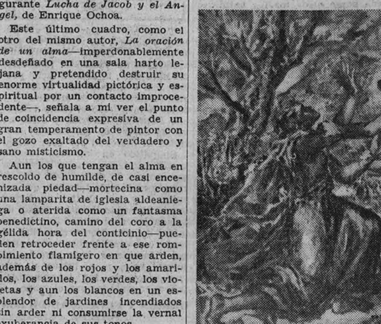
"La lucha con el Ángel", por Enrique Ochoa

tan agua vieja en un cántaro roto, para beber, pan duro y embohecado para comer, dura tarima para dormir. Al verle andar por la tierra diríase un árbol muerto que empuja misterioso venticello. La humana apariencia de su ser de lagado rastro de hedor y de carne ligada por los divinos estigmas. Y, sin embargo, el Pobrecillo de Asís es un prodigioso surtidor de magnificencias interiores, de aromas ultraterrenos, de sinfonías apasionadas. Canta al sol y a cuanto de su radiante luz se nutre y regocilla: flores, pájaros, insectos vegetales, aguas, nubes. El mundo es para él, y quisiera que para todos, como una infinita armonía de claridades y de sonidos: