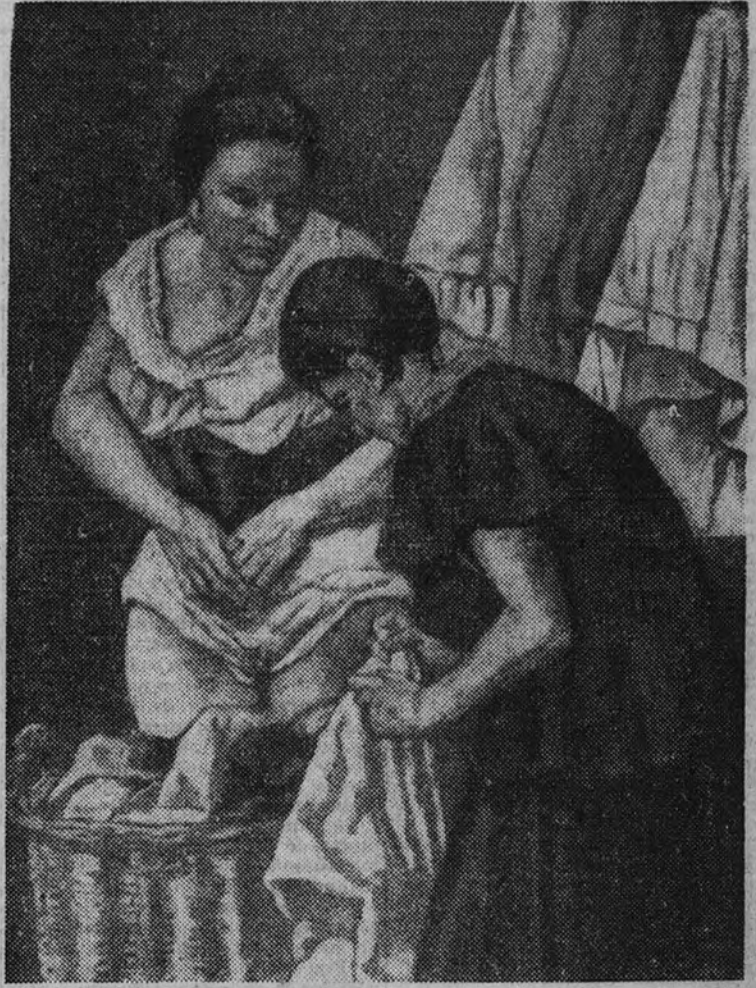
"Las lavanderas", de Gutiérrez Solana

¡Qué lejano el carnaval de Solana de la versión elegante y sentimental de Watteau, Verelaine y Schumann! Es una visión aldeana o de suburbio la de nuestro genial pintor, con un fondo de paisaje desolado, grotesco e impresionante. En esta divertida estampa predomina el dibujo sobre el color. Solana se preocupa, en primer término, del problema constructivo dentro de un profundo sentido realista, vigorizándose las formas sobre la base negra del contorno. El color, que no sirve de fundamento a la creación, se evade aquí de todo tratamiento armónico. Pictóricamente esta obra está superada por el cuadro "Las lavanderas" , uno de los más completos que conocemos de Solana, por la entonación profunda, el modelado y el empaste robustos, el equilibrio to-