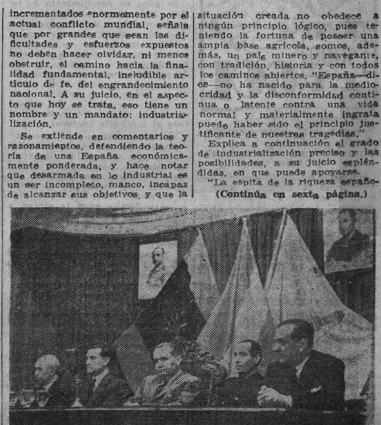
El Ministro de Industria y Comercio, en la presidencia de la conferencia del señor Suances sobre Minería

A continuación, y comentando los esfuerzos que en todos los órdenes se desarrollan para superar las dificultades creadas por la República y la guerra de Liberación,