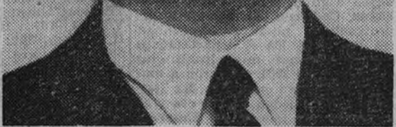
El Ministro de la Gobernación que ha pronunciado un interesante discurso en la sesión final del Congreso de tisiólogos.

En la sesión última de la reunión anual de tisiólogos, puericultores y médicos de Sanidad que acaba de celebrarse en Madrid, el excelentísimo señor Ministro de la Gobernación pronunció un interesante discurso que fue broche final y digno colofón de las brillantes deliberaciones científicas que clausuraba. Al analizar la situación médicosocial de la tuberculosis, ofreciendo a los asambleístas una conveniente transformación de la organización de estos servicios en forma que puedan rendir todo su efecto útil. Si no fueran otros muchos los aspectos bajo los cuales la reunión de tisiólogos y puericultores ha de traducirse en modificaciones benéficas, bastaría la nueva orientación que aparece en el horizonte sanitario en el sentido de dar la mayor potencialidad a la lucha antituberculosa, para demostrar el éxito de las sesiones celebradas y la justificación de su convocatoria.