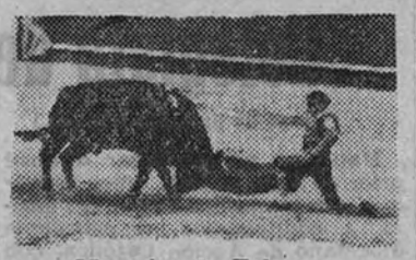
Morenito de Talavera