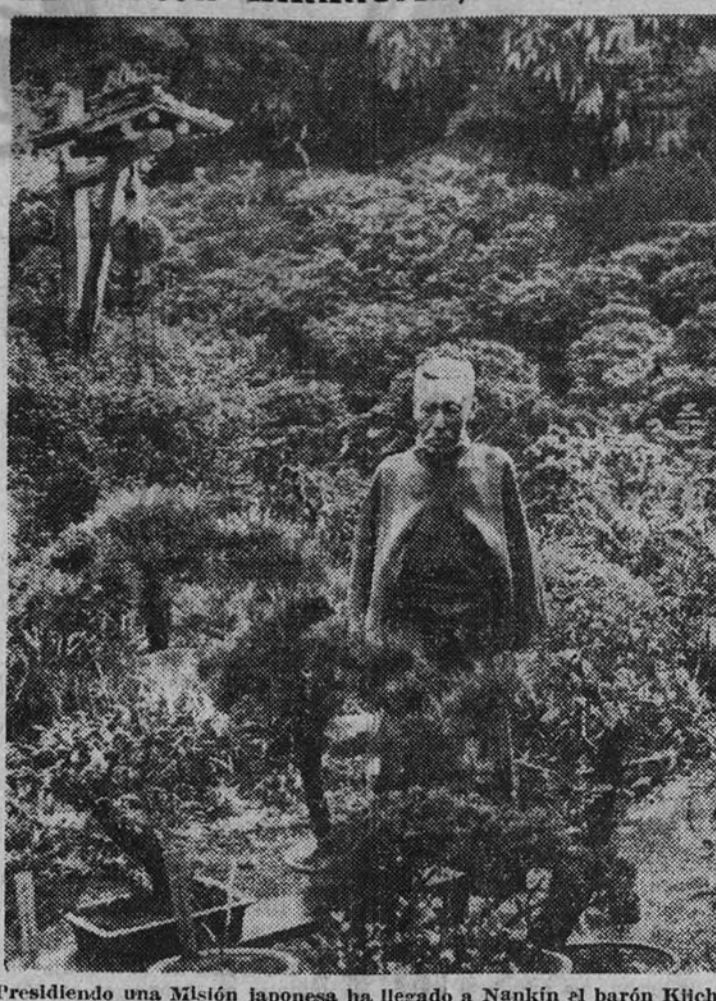
Presidiendo una Misión japonesa ha llegado a Nankín el barón Kichiro Hiranuma. De su Misión se esperan importantes resultados para el futuro