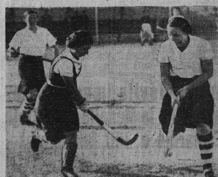
Trabamos esta estampa de otro Campeonato, en que el Atlético madrileño quedó campeón

Toman parte equipos guipuzcoanos, catalanes y madrileños