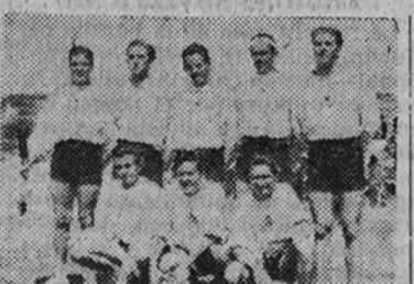
El equipo del S. E. U. de Madrid, que hoy juega con el C. N. de Palma, que le venció en el primer partido por gran diferencia

TOLEDO 4. — En la Escuela Central de Educación Física continuaron disputándose las pruebas del Campeonato Nacional Militar, con la participación de alumnos de todas las Academias. En la prueba del penthalon atlético, la clasificación por equipos ha quedado establecida así: 1. Academia de Guadalajara; 2. Academia General de Toledo; 3. Academia de Artillería; 4. Academia de Intendencia; 5. Academia de Ingenieros; 6. Academia de Caballería; y 7. Academia de Sanidad.