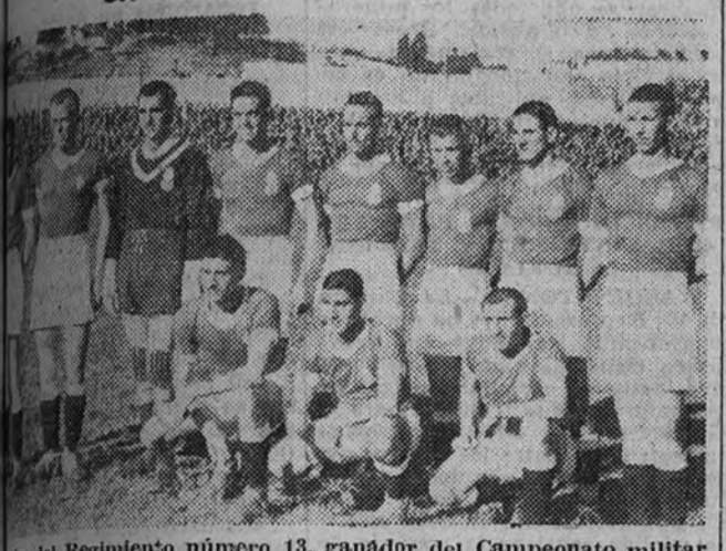
El equipo del Regimiento número 13, ganador del Campeonato militar de la primera región

ambos equipos practicaron un juego de extrema corrección