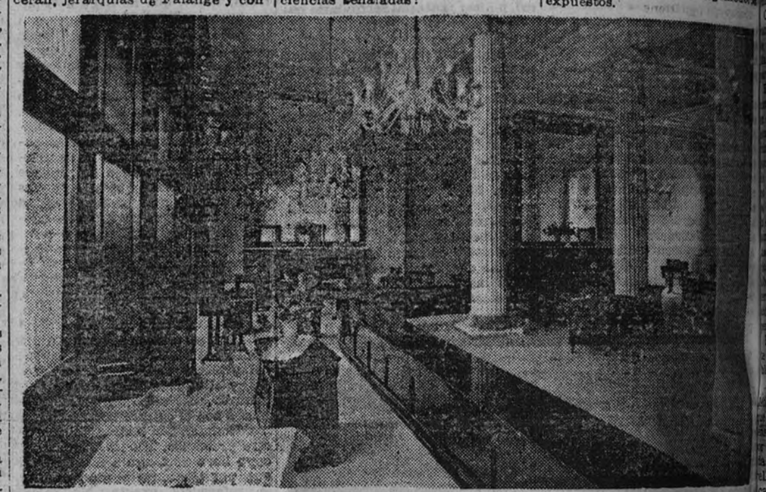
La inauguración del Salón Exposición y Venta de las Máquinas de Coser y Bordar "Alfa", en Barcelona.

La inauguración de la Casa "Alfa" en Barcelona fue, como hemos dicho, un prodigio de éxito, un éxito completo, tanto en la selección de los asistentes como por la calidad de los modelos expuestos.