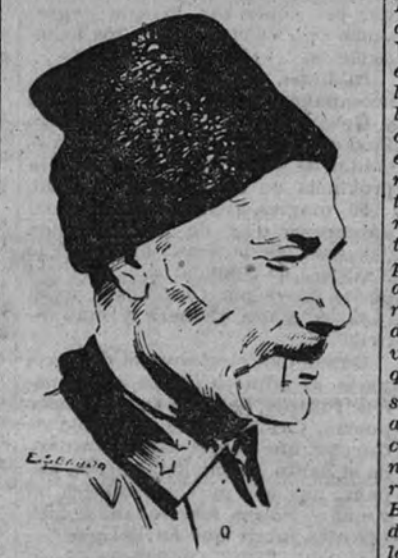
El general Vlasov, jefe del movimiento antibolchevique ruso, que está pronunciando unos interesantes discursos en las poblaciones rusas liberadas por los alemanes

Una arruga, ni una línea a los cuarenta y cinco años. Una piel perfecta, impecable, como la de una muchacha joven. Dichosa de milagro, pero todo esto es una explicación científica y es indispensable para que desee lograr una juventud eterna, "Bleoc" está a tu alcance. Mezclada con la Crema "Bleoc" (color rosa), y por la mañana y por la noche, cuando te levantas y cuando te acuestas, te hará sentir la suavidad y la frescura de la juventud y la belleza de la mujer. Usted misma, admira de las maravillas de la Crema "Bleoc". Devolvémosla a usted el mismo día. La Crema "Bleoc" le devuelve el aspecto fresco y juvenil. Usted misma lo verá. Mezclada con la Crema "Bleoc" (color rosa), y por la mañana y por la noche, cuando te levantas y cuando te acuestas, te hará sentir la suavidad y la frescura de la juventud y la belleza de la mujer. Usted misma, admira de las maravillas de la Crema "Bleoc". Devolvémosla a usted el mismo día. La Crema "Bleoc" le devuelve el aspecto fresco y juvenil. Usted misma lo verá.