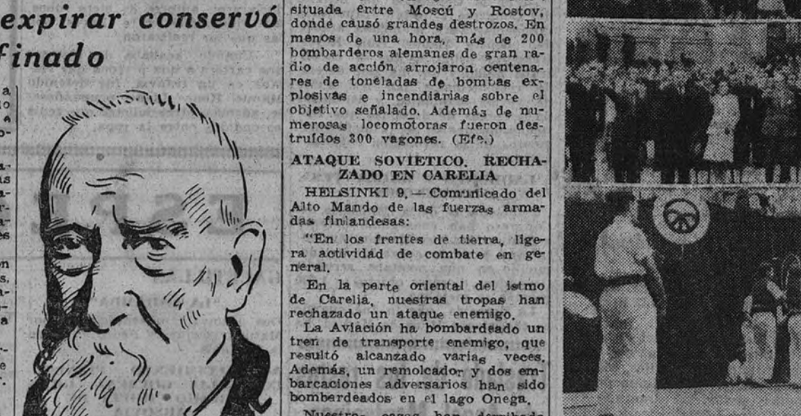
Los Coros de Educación y Descanso de Bilbao actuaron en la Secretaría General

Asistieron los Ministros Secretario del Partido, de Justicia y Educación, Presidente de las Cortes y otras personalidades