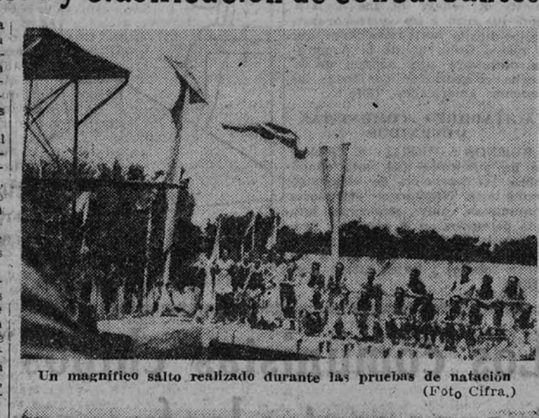
Un magnifico salto realizado durante las pruebas de natación