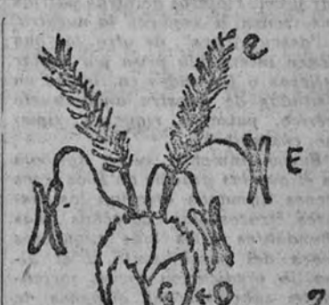
Flor de trigo.—G. glomérula.—O, ovario. Estigmas plumosos. E, embrión.

En estos días, cuando tanto ocupa y preocupa la cosecha de trigo — tan castigada por la sequía y el calor, en las comarcas tardías de recolección atrasada —, no creemos que esté de más saber algo de este rubro grano, base de la alimentación del mundo. Realizar una breve y no profunda incursión por los campos de la Botánica. El trigo es una gramínea, familia de plantas en su mayoría herbáceas, con tallos — cañas — de forma cilíndrica, y huecos, por lo general, en sus entrenudos, aunque algunos, los del maíz y caña de azúcar, entre otros, sean macizos. Las hojas, situadas a lo largo de dos de las generatrices del cilindro, que puede suponerse es el tallo — disposición diatílica —, son largas, estrechas, rectilíneas, con vaina abierta, sin soldarse en sus bordes, y dotadas de una laminita membranosa, emplazada a continuación de la vaina, y que se llama ligula. Las flores se hallan reunidas en pequeños grupos, "espiguillas", insertas por separado a lo largo de un eje escalonado llamado "raquis": bien "sentadas" directamente sobre éste, formando lo que se llama una "espiga compuesta" — caso del trigo —, o más o menos largamente pediceladas: panícula o panoja de la avena. En el trigo, cada espiguilla se halla formada de dos brácteas es-