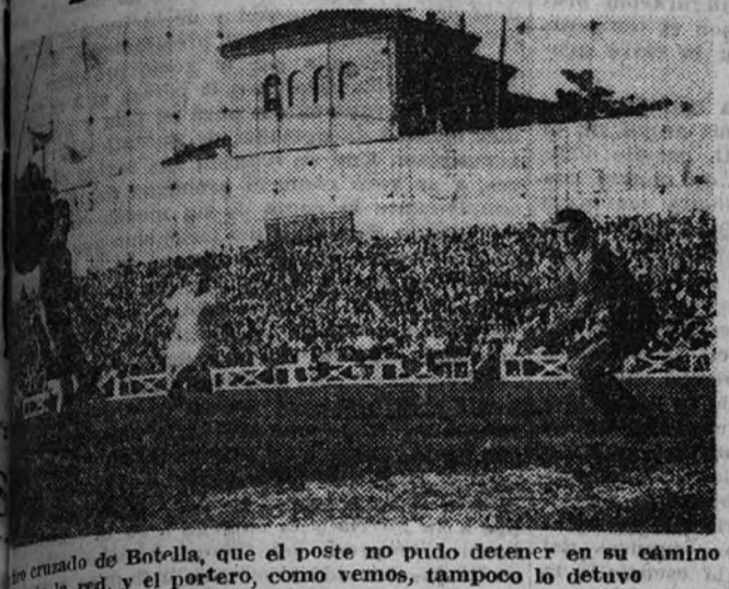
El cruce de Botella, que el poste no pudo detener en su camino hacia la red, y el portero, como vemos, tampoco lo detuvo

¿Será ver otro Madrid igual y un Barcelona tan desorientado?