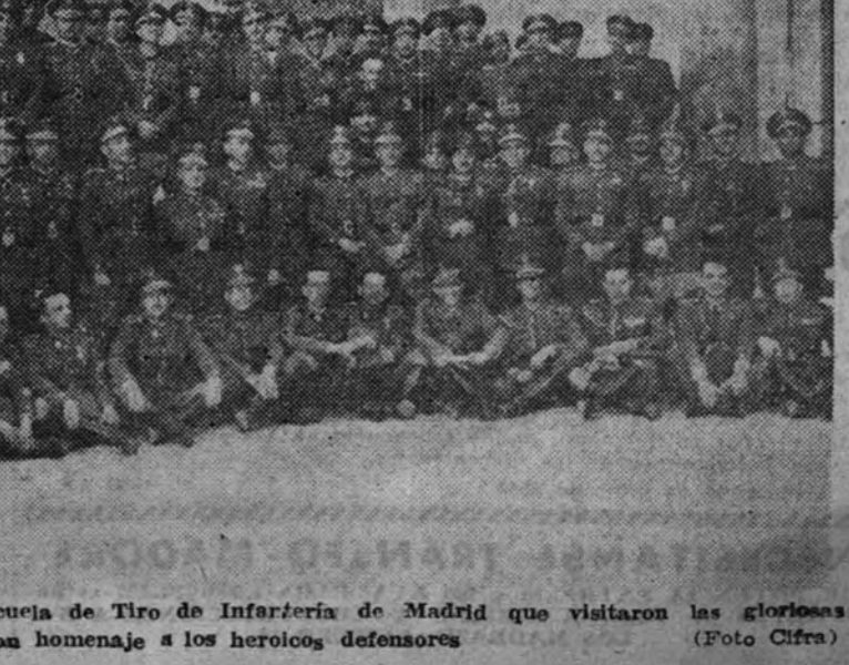
Grupo de comandantes de la Escuela de Tiro de Infantería de Madrid que visitaron las gloriosas ruinas del Alcazar, donde rindieron homenaje a los heroicos defensores.