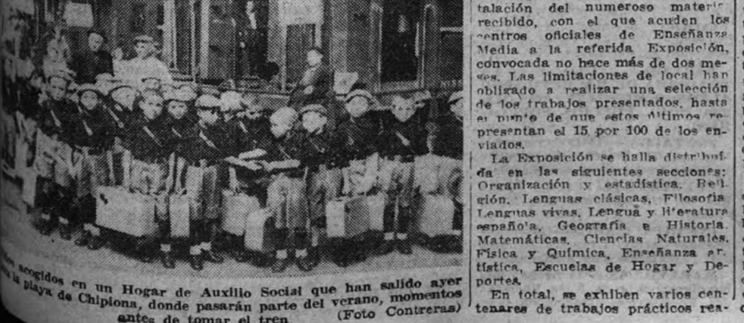
Los niños acogidos en un Hogar de Auxilio Social que han salido ayer a la playa de Chipiona, donde pasarán parte del verano, momentos antes de tomar el tren.

Niños acogidos por la Falange marchan al mar