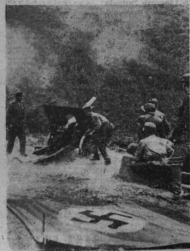
Una batería del Ejército alemán abre fuego contra las posiciones de los comunistas serbios en una operación de castigo.