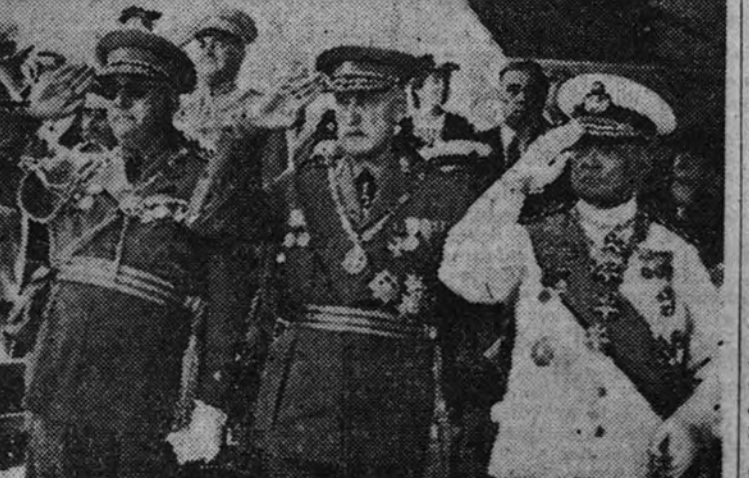
Altos oficiales del Ejército y la Armada portuguesa toman parte en las fiestas del XVII aniversario del Alzamiento nacional