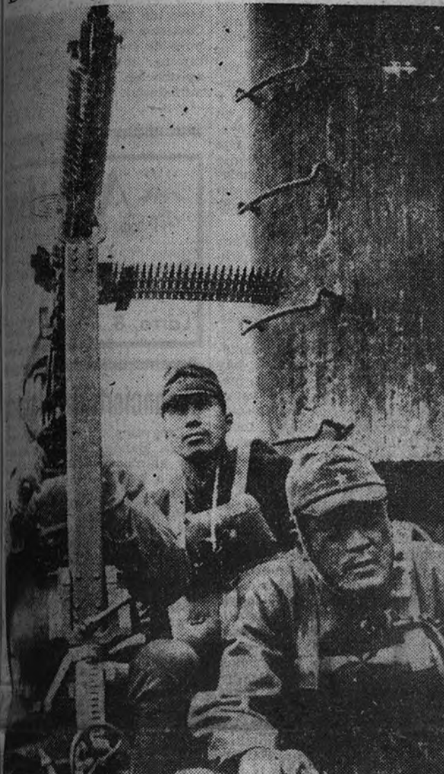
Comandante de un buque japonés con sus sirvientes, durante la lucha en las Islas Aleutianas.