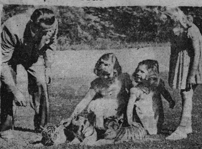
Las niñas del Rey de Suecia juegan con pequeños tigres que les ha regalado el Parque Zoológico de Estocolmo