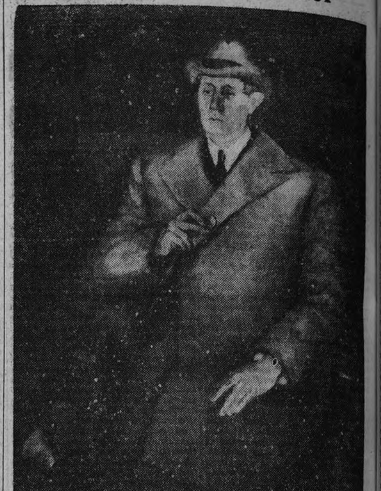
Retrato de Azorín, por Vázquez Díaz