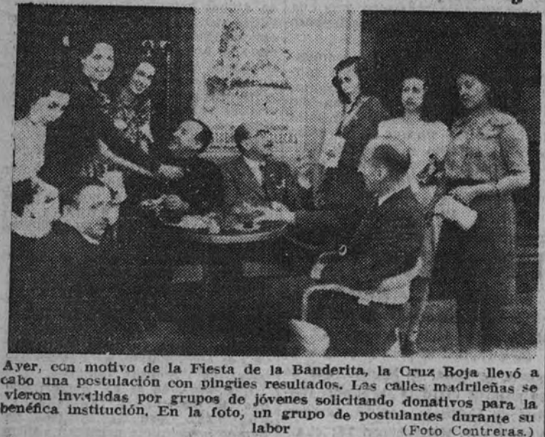
Ayer, con motivo de la Fiesta de la Bandera, la Cruz Roja llevó a cabo una postulación por pingües resultados. Las calles madrileñas se vieron invadidas por grupos de jóvenes solicitando donativos para la benéfica institución. En la foto, un grupo de postulantes durante su labor.