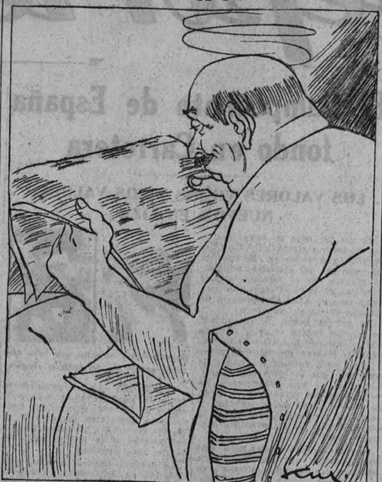
—Bien, bien; así podrá uno andar por la ciudad sin mancharse!

El "Boletín Oficial del Estado" publica hoy, entre otras, las siguientes disposiciones: