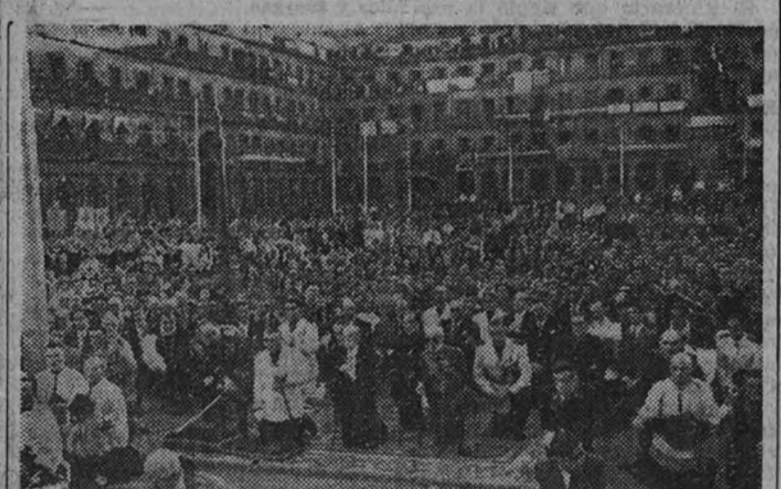
La presidencia de la procesión en Madrid

Su Excelencia el Jefe del Estado ha presenciado, desde uno de los balcones de su residencia de El Pardo, la procesión del Corpus, que salió de la iglesia parroquial del pueblo para hacer su recorrido tradicional. Cubrieron la carrera tropas del regimiento de Transmisiones y de la Casa Militar de Su Excelencia. Abrió marcha en la procesión una escuadra de la Guardia Civil de Caballería de la Casa Militar del Generalísimo, en traje de gran gala, y seguía el Frente de Juventudes, niños y niñas de las Escuelas nacionales, Ordenes religiosos y Acción Católica. Detrás iba el Clero y, a continuación, la presidencia, en la que figuraban el Jefe de la Casa Civil de Su Excelencia, el Alcalde, el comandante militar de la