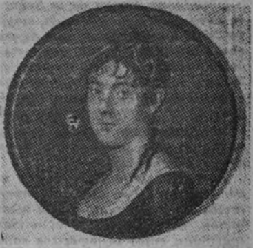
La VII duquesa de Montijo, de G. Ducker

Es este de la miniatura-retrato este otro misterio de la investigación artística española que conviene aclarar prontamente.