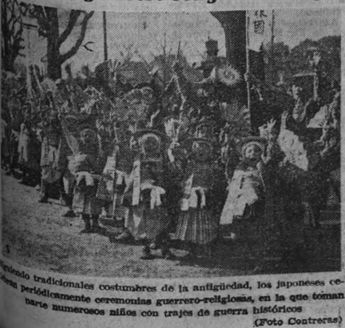
Tradicional ceremonias guerrero-religiosas, en la que toman parte numerosos niños con trajes de guerra históricos