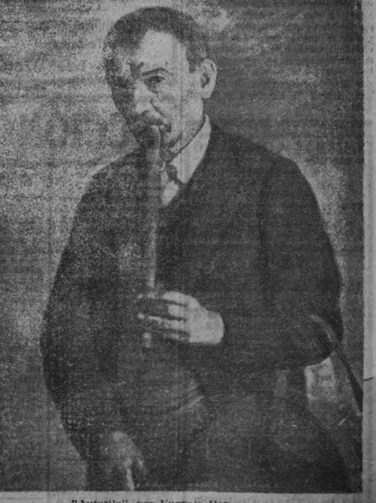
"Autorito", por Eugenio Hermosa