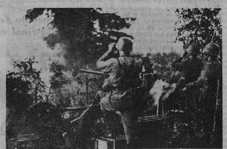
Los servidores finlandeses de una plaza antitanque vigilan los movimientos del enemigo, atentos a rechazar cualquier ataque