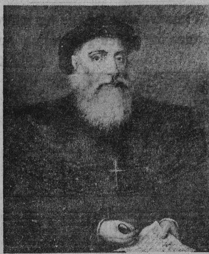
Vasco de Gama

Esta brava y arriesgada expedición que dio como inmediato re-