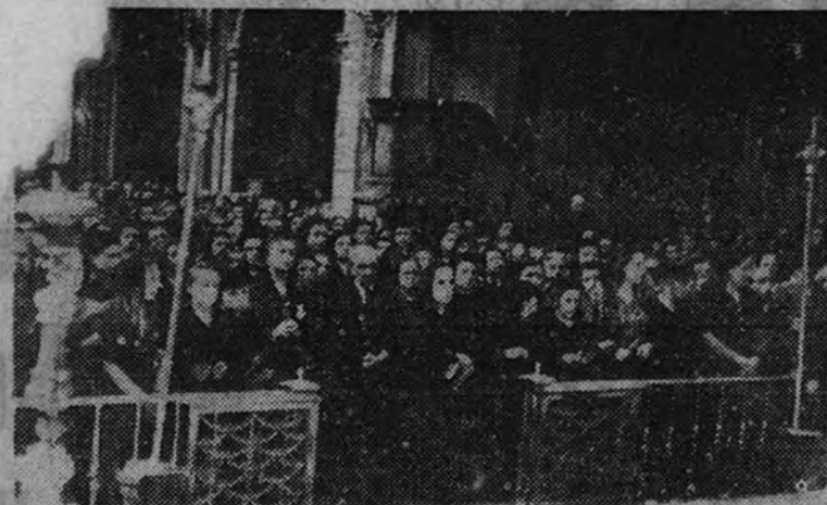
Aspecto que ofrecía la iglesia durante el funeral

En la procesión de mañana oficiará el Prelado