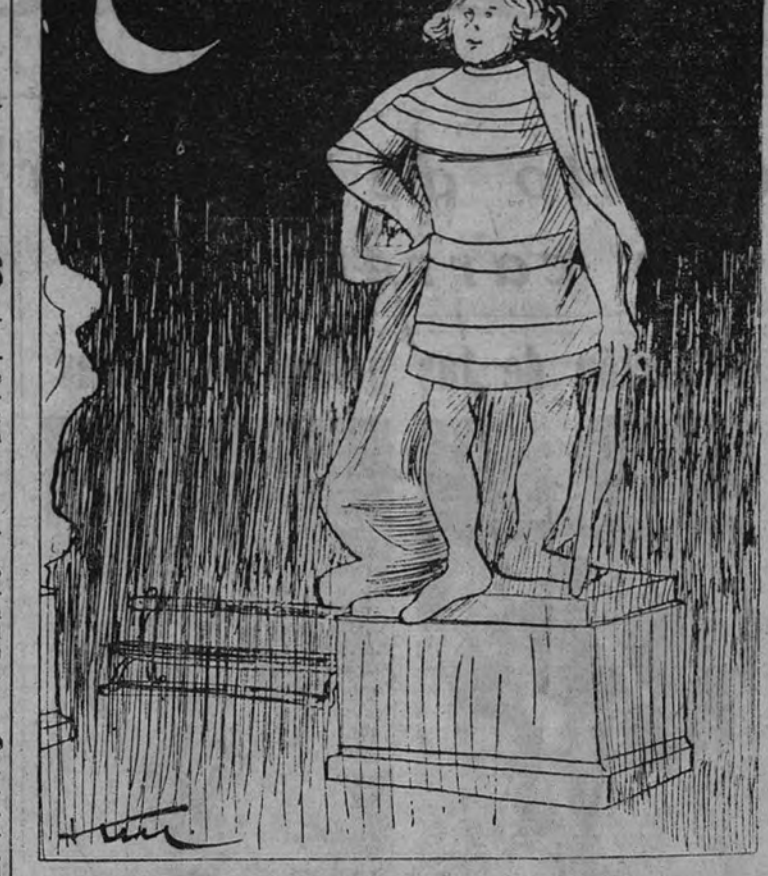
—Sólo para nosotros, y porque somos de piedra!