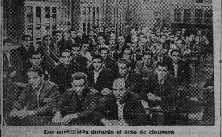
Los cursillistas durante el acto de clausura

Asistieron los directores generales de Estadística y Jurisdicción del Trabajo