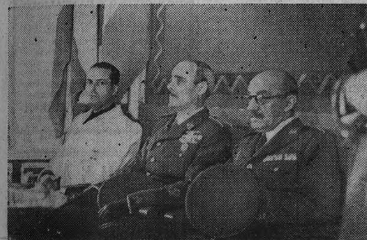
Los Ministros del Ejército y de la Gobernación presiden el acto de entrega de despachos

Presidido por los Ministros del Ejército y de la Gobernación, se celebró ayer mañana en el Centro de Instrucción de la Guardia Civil la entrega de los despachos de los 85 tenientes de la Guardia Civil a los 85 brigadas del benemérito Instituto que han hecho los cursos de capacitación para el ascenso en dicho Centro.