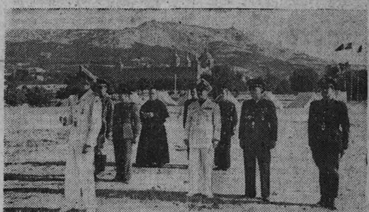
El Delegado Nacional del Frente de Juventudes pronuncia su discurso en el acto inaugural del Campamento

Los Inspectores del Frente de Juventudes