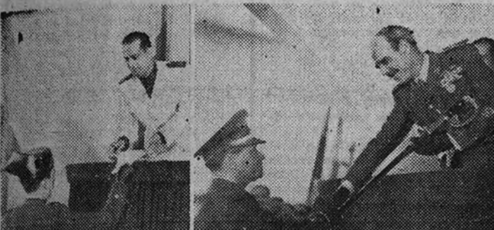
El Ministro de la Gobernación entrega los despachos y el del Ejército concede el sable de honor al número uno de la promoción

Presidieron el acto los Ministros del Ejército y de la Gobernación