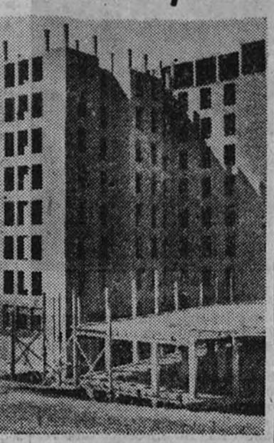
PROTECCION DEL NUEVO ESTADO A ESTE TIPO DE CONSTRUCCIONES

Pocos días después de terminar nuestra guerra de Liberación, el Caudillo Franco promulgaba una hermosa ley—el 19 de abril de 1939—protegiendo la construcción de viviendas con precios asequibles a la mayoría de los españoles modestos o de clase media. En esta ley se concedió desde entonces en mérito, que llegara a la mitad del coste total de las viviendas, hasta la preferencia en el suministro de materiales a favor de los constructores de viviendas protegidas, o lo que es igual, de las viviendas cuyos constructores se han acogido a los beneficios de esta ley. Para completar esta ley, la Presidencia del Gobierno dictó una orden ministerial con fecha 18 de junio de 1940 y en la cual se añadían y concretaban algunas otras modalidades de amparo a las entidades constructoras de viviendas de renta moderada.