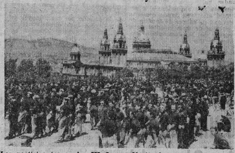
Los participantes en los III Juegos Nacionales esperan cerca del Estadio de Montjuich, la orden de comer