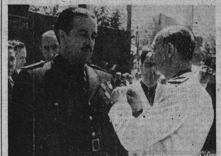
El Alcalde de Manresa impone la Medalla de Oro de la ciudad al Ministro de Trabajo, camarada Giron.

EL CAMARADA GIRON PRONUNCIO UN IMPORTANTE DISCURSO