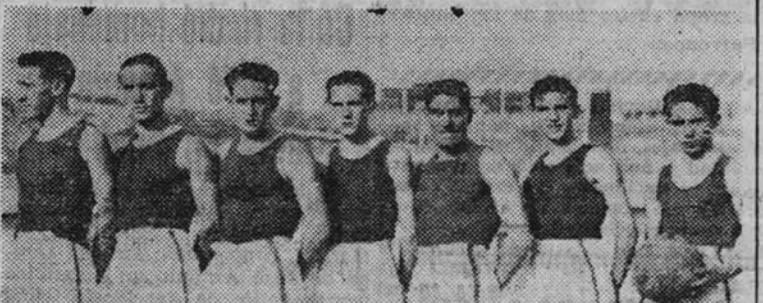
Equipo del Imperio de Segovia del F. de J., vencedor de la Copa Primavera de baloncesto de la Federación Castellana

De gran sorpresa hay que calificar el resultado de este partido final de la Copa Primavera de baloncesto de la Federación Castellana. Llegaban a este encuentro el Imperio de Segovia del Frente de Juventudes y el América de Madrid. El Imperio, por su mejor puesto en la clasificación, tenía que conceder dos puntos de ventaja a su rival. No era esta pequeña ventaja, lo que nos llevaba a dar como favorito al equipo madrileño; era su veteranía que no fue suficiente para contener al equipo de Segovia.