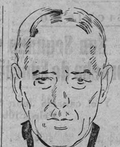
Stimson, ministro de la Guerra de los Estados Unidos

En el canal de la Mancha, unidades de la Marina del Reich han echado a pique un contratorpedero y dos cañoneros británicos