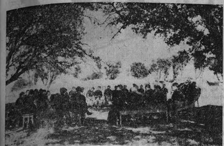
Una lección al aire libre

Problema es el de la repoblación forestal que hace tiempo existe en España de importancia y de urgencia suficiente para que se haya planteado ya en forma de apostolado en aquellos ámbitos selectos que aciertaron a sentir en toda su grandeza y se propusieron contribuir a su resolución.