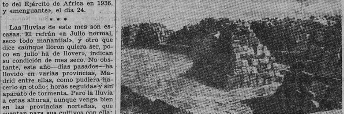
Turba cortada en pequeños bloques y aplada

(I) Véase la página de Agricultura y Ganadería de 20 de junio último.