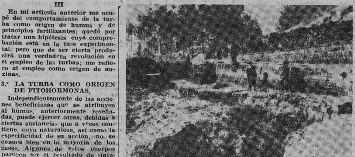
Trozo de terreno donde se aprecia el espesor de distintas capas de turba

esté demostrada la formación de fitohormonas por los microorganismos.