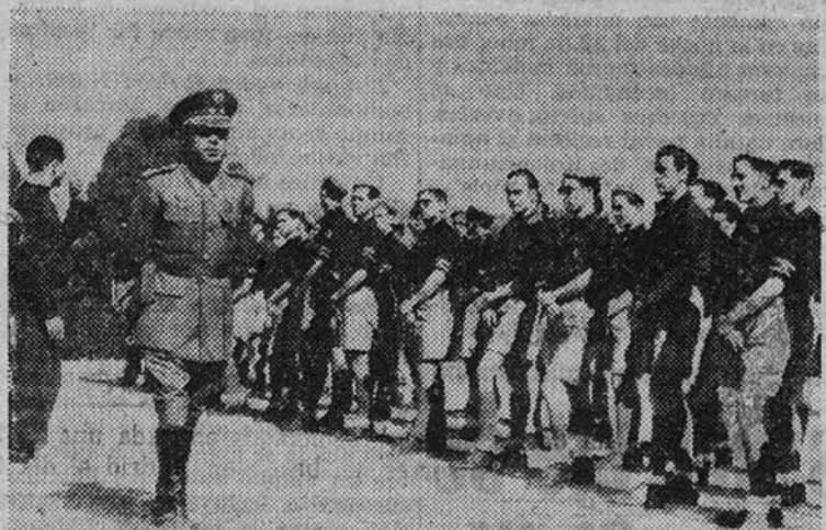
El teniente coronel Aguilá, jefe Nacional de Educación Física del Frente de Juventudes, da las últimas instrucciones antes del comienzo de los III Juegos Nacionales.

Las banderas de cada provincia figurarán en los mástiles de los altos del Estadio, y en la testera de los miles de cadetes que saldrán entusiasmados a los corredores de cada equipo provincial, según sus colores.