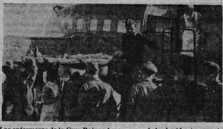
Las enfermeras de la Cruz Roja se hacen cargo de los heridos tan pronto como llegan al frente