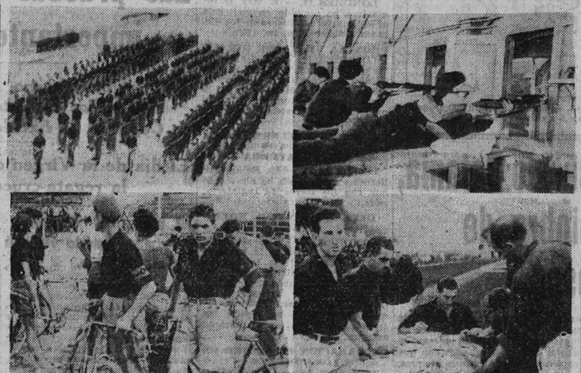
En la parte superior izquierda los participantes escuchan instrucciones para la jornada próxima. Derecha: Los seleccionados de tiro se entrenan. En la parte inferior izquierda: Los ciclistas esperan la orden de dar una vuelta a tren suave. Derecha: El Jurado de las pruebas de atletismo en Montjuich.

BARCELONA 14. (Por teléfono). De nuestra enviada especial. La segunda jornada de los Juegos Nacionales Juveniles tenía un carácter de transición, ya que las pruebas de atletismo, por la gran cantidad de elementos que en ellas participan, se han ido realizando en días sucesivos. Hoy, por el contrario, se han celebrado las pruebas de tiro y ciclismo, que por su naturaleza, requieren de una mayor concentración y de un mayor número de participantes.