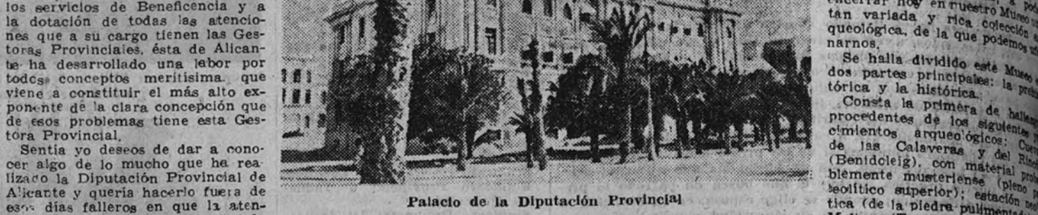
Palacio de la Diputación Provincial

Conjugándose de modo maravilloso con la reedición vital que asumen todas las actividades económicas de la provincia; respondiendo de manera cumplida, de una parte, a la órbita misional que, como función suya específica tiene asignada, y de otra, al sentido de reconstrucción que en patriótico entusiasmo incluye imprimir a los servicios de Beneficencia y a la dotación de todas las atenciones que a su cargo tienen las Gestoras Provinciales, ésta de Alicante ha desarrollado una labor por todos conceptos meritoria, que viene a constituir la más alta exponente de la clara concepción de esos problemas tiene esta Gestora Provincial.