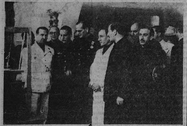
Autoridades y jerarquías en la apertura del Mercado de Artesanía

Asistieron el Delegado Nacional de Sindicatos, Jefe Provincial del Movimiento y otras jerarquías