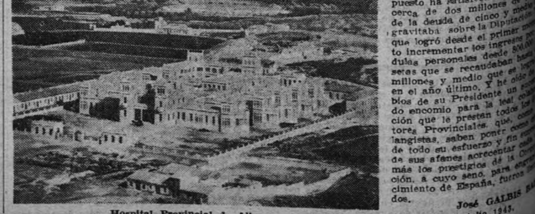
Hospital Provincial de Alicante

Una vez desalojado el Hospital Militar de las Casas de Beneficencia, en las fechas que ya te he indicado, tuvimos necesidad de realizar en ellas importantes obras de reparación y de las pusieron en condiciones de atender cumplidamente a su misión. Al presente, estas Casas de Beneficencia provincial, a las que he