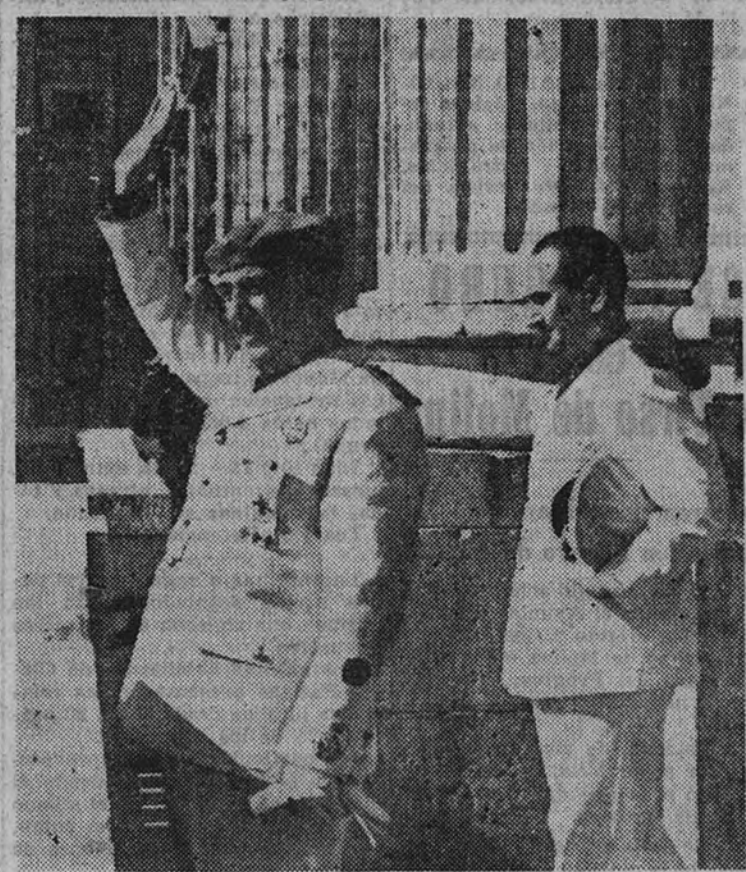
El Caudillo, acompañado del Ministro Secretario, saluda brazo en alto a la muchedumbre congregada en la plaza de la Armería, que le aclama con entusiasmo indescribible.

mos estarlo; primero, porque, no obstante haber transcurrido estos años en una larga cadena de esfuerzos y sacrificios para lograr el perfeccionamiento de nuestro Régimen, siempre nos parecerá poco lo que en servicio de la Nación logremos, y segundo, porque el Estado actual no puede ser juzgado a través de las molestias que a los