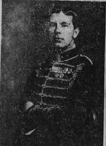
El Príncipe heredero, Gustavo Adolfo

Hay aquí como un país neutral rodeado de beligerantes se previene minuciosamente para rechazar cualquier intento violento de sacarle de su voluntaria situación de paz.