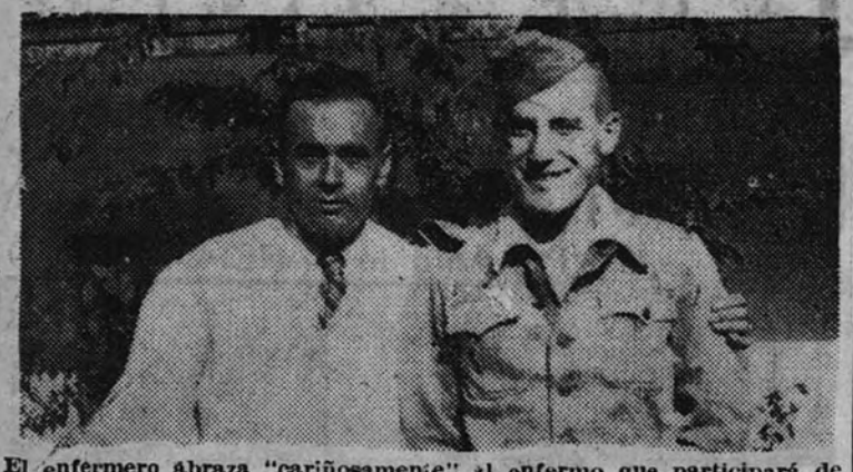
El enfermero abraza "carinosamente" al enfermo que participará de una herencia de ocho millones de dólares

Todos cuantos hemos nacido en Asturias mantuvimos la idea de hacernos en el muelle de Gijón una fotografía al minuto, dejaria a los familiares y partir con rumbo a América en el primer barco que atracara en El Musel, para, después de muchos años, volver ricos, comprar un chalet en una villa marinera... por ese amor al mar que nos dió la fortuna—y pensar en un buen coche entre la envidia de los que prefirieron quedarse aquí, al lado de la lumbrera, machacando terrones o segundo hierba en las praderas del Rusón o en la Cima... Si; cualquiera de nosotros quería ser como el indiano aquel, que fumaba puros de metro y medio, tenía dientes de oro y preguntaba la moza, metida de lleno en la faena de la siega, cómo se llamaba el "garabatu". Cada verano venía al pueblo un "americano", que era la persona admirada y mimada por todos, en las boleras, en las cometas, en las reuniones de vecinos, bajo la higuera a la luz plena de luna en la noche estival. De los ejemplos de los que volaban más pobres que las arañas, y con el sello de la muerte en su organismo deshecho, nadie se acordaba, porque esos pobres hombres escondían su fracaso en la penumbra de una habitación humilde esperando la última hora, triste hora de su vida.