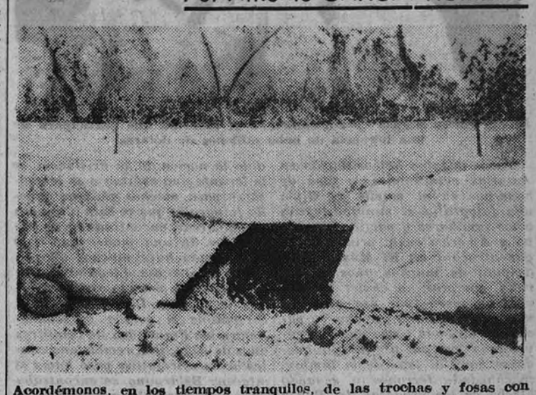
Acordémonos, en los tiempos tranquilos, de las trochas y fosas con que procurábamos contener el avance de la langosta