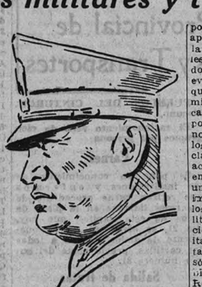
GRAN CUARTEL GENERAL DEL DUCE 20. (Urgente.)

En el patio del Cuartel se levantó un altar, presidido por una Cruz, a la que daban guardia la escuadra de gastadores del regimiento de Infantería número 2.