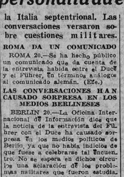
GRAN CUARTEL GENERAL DEL DUCE 20. (Urgente.)

En el patio del Cuartel se levantó un altar, presidido por una Cruz, a la que daban guardia la escuadra de gastadores del regimiento de Infantería número 2.