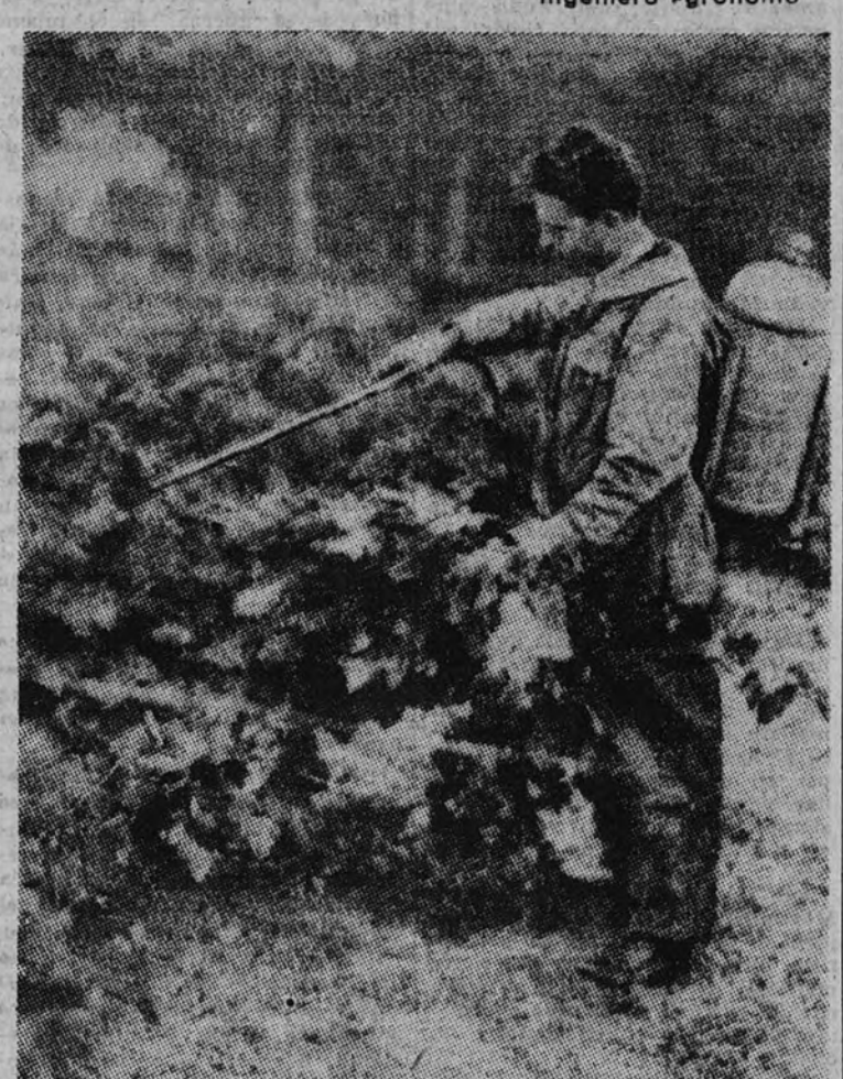
Obreiro pulverizando un viñedo para defenderle del Mildiu

No hay tal vez ninguna planta cultivada que sea atacada por tan gran número de plagas como la vid. Abundan, en efecto, los parásitos, ya animales o vegetales, que son específicamente huéspedes de nuestro preciado arbusto. Su abundante follaje, con hojas de amplio limbo, más o menos peloso y provisto de numerosos estomas, ofrecen campo excelente, muy vulnerable, para invasiones de hongos de diversas clases, entre los cuales, por la virulencia y amplitud de sus ataques, descuella el mildiu, objeto de estas notas.