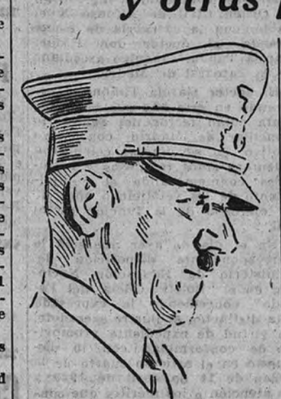
GRAN CUARTEL GENERAL DEL FUHRER 20. (Urgente.)

A ellas asistieron los Altos Mandos alemanes e italianos y otras personalidades militares y técnicas