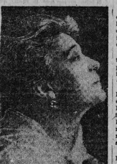
Eleonora Duse, cuando ya tenía que retratarse: «dirigiendo la cabeza para que el cuello no acusase arrugas».

Entre otros públicos esta preocupación no existe. Es ineludible referirse al «caso» de Sara Bernhardt. ¿Cuántos años de actualidad mundial? Y ni París, ni Londres, ni Estados Unidos escatimaron su idolatría por Sara Bernhardt. ¿Cuántos años de actualidad mundial? Y ni París, ni Londres, ni Estados Unidos escatimaron su idolatría por Sara Bernhardt.