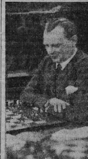
Alekhine, el gran pensador y sólo mediano simultaneador

Al analizar las características y cualidades de cada jugador entonces destacan en él facetas y detalles que a algunas veces no se conocían o pasaban sin conocer. Estas cualidades se encuentran en muchos jugadores de gran clase internacional y en otros está a un paso de completarse, por ejemplo, el gran Lasser, aquel invencible campeón mundial, era poco más que un aprendiz comparado como simultaneador al cubano Capablanca. El mismo Alekhine, siendo el superhombre de la época, quedaba reducido a muy poco haciendo esta clase de exhibiciones frente a Polhor y, por fin, el genial Reti y el originalísimo Nimzovich eran en materia de conferencias algo mejores que el más destacado en esta especialidad de los que hoy la practican.