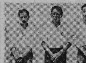
La línea delantera del Real Club de Campo

Cataluña marcha en cabeza, con ocho equipos en su torneo regional, siguiendo Castilla, con siete, y después Guipúzcoa y Valencia. En estas regiones se ha practicado el hockey durante toda la temporada, comenzando con los Campeonatos regionales—Guipúzcoa tuvo una Copa de Oro—y terminando con la Copa Primavera.