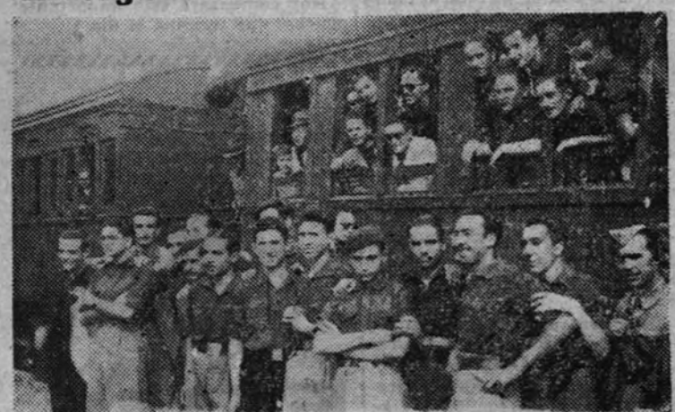
Camorras pertenecientes al S. E. U., que marchan al Albergue de Camorras (Sanlúcar de Barrameda), donde permanecerán una temporada. La Jara (Sanlúcar de Barrameda), donde permanecerán una temporada. A despedirlos a la estación acudieron las jerarquías del Movimiento. (Foto Santos.)

Ocupación de Cefalu. LONDRES 26.—Radio Argel anuncia la ocupación por las fuerzas aliadas de Cefalu, localidad situada a unas 50 millas de Palermo en la carretera de la costa. (Efe.)