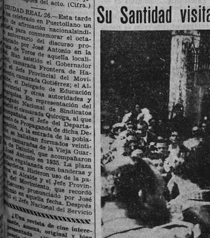
Después del bombardeo de Roma, Su Santidad el Papa visitó los lugares damnificados. El Pontífice, entre sus fieles, reparte los consuelos espirituales que su bondad y su corazón amantísimo envían a todos los desgraciados del mundo

Una revista de cine interesante, amena, original y bien presentada, viene de ser de «REVISTA DE CINE INTERESANTE». Lea unos números y, si le agrada, suscribese para recibirla todas las semanas.