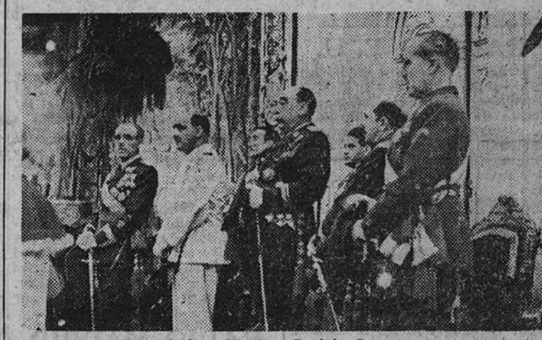
Los Ministros del Ejército y Marina, Capitán General y otros generales, presiden la misa organizada por el Arma de Caballería en la iglesia del Buen Suceso

El Ministro de la Gobernación presidió la función religiosa en San Francisco el Grande