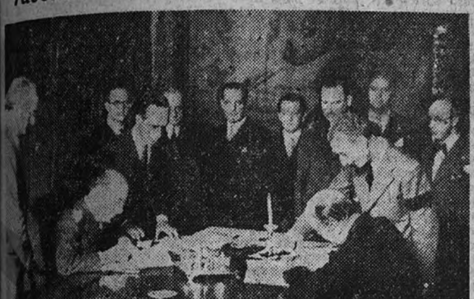
En la mañana de ayer se efectuó en el palacio de Santa Cruz la firma del acuerdo de pagos y convenio comercial que se celebró entre los Gobiernos español y colombiano.

Se aplica la cláusula de nación más favorecida a determinadas mercancías