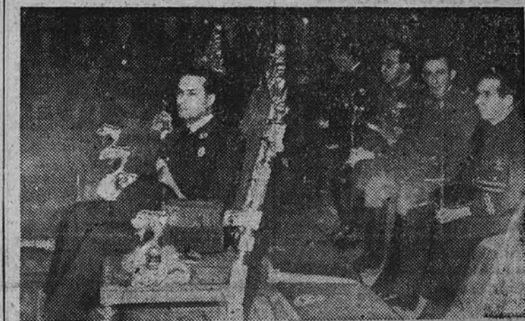
El Ministro de la Gobernación preside la misa celebrada en San Francisco el Grande