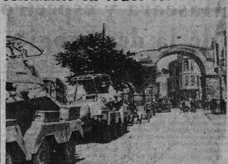
Una sección de la 12ª división de carros de combate cruza las pacíficas calles de Salónica en marcha hacia lugares donde pueda ser conveniente su presencia