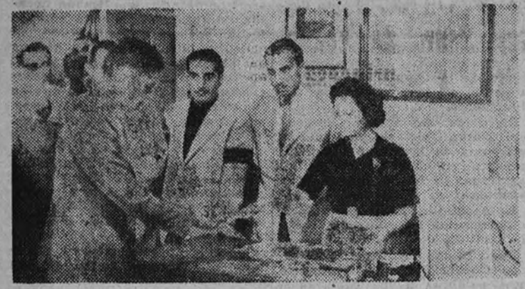
Ha sido clausurado el curso en la Escuela Profesional de Confeitería de la Delegación de Sindicatos. El grabado recoge un momento del reparto de premios efectuado con tal motivo

Se concedieron premios en metálico a las primeras calificaciones