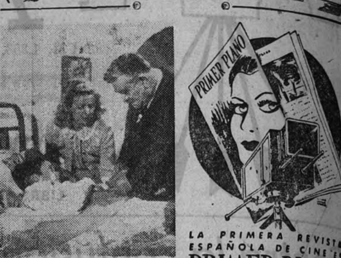
Un fotograma de la realización de Mario Mattoli "Yo quiero vivir así", que se estrena mañana.