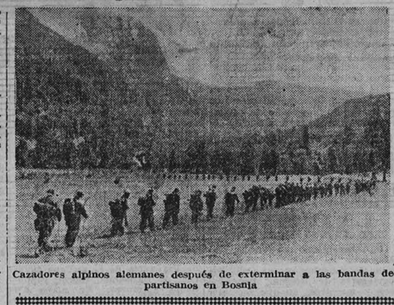
Cazadores alpinos alemanes después de exterminar a las bandas de partisanos en Bosnia

CUARTEL GENERAL DEL FUHRER 2.—El Alto Mando de las fuerzas armadas alemanas comunicó: "En el frente del Mius nuestras tropas han conquistado, al asalto, una posición montañosa que domina las líneas enemigas. El adversario ha sufrido elevadas pérdidas humanas y materiales. Al suroeste de Orel han sido rechazados, con pérdidas sangrientas, para el enemigo, varios ataques efectuados por los soviets con infantería y carros de asalto; fueron destruidos gran número de éstos. La Aviación germana ha intervenido en los puntos neurálgicos de actividad del frente oriental con escuadras de aviones de combate y de batalla. Seis trenes de transporte y uno blindado han sido destruidos. En el sector de Kandalakcha, los granaderos alemanes han interceptado y dispersado dos batallones enemigos que se escondían en un bosque impenetrable." (Efe.)