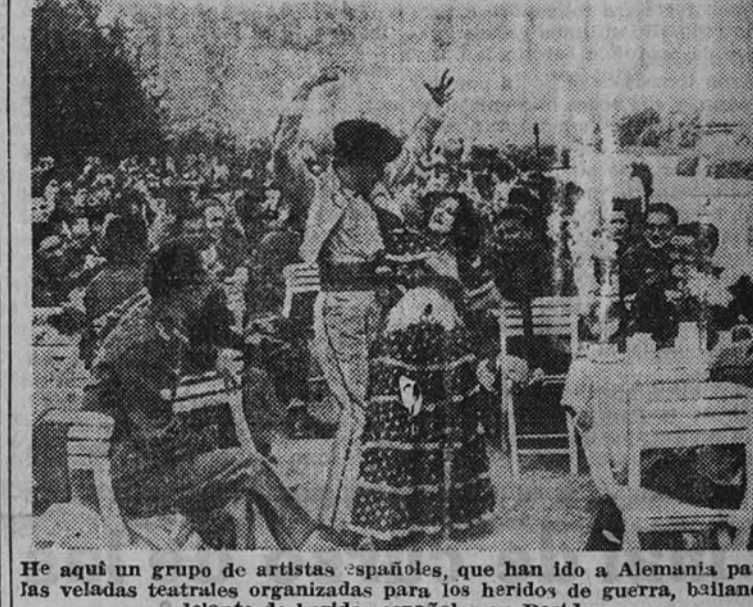
He aquí un grupo de artistas españoles, que han ido a Alemania para las veladas teatrales organizadas para los heridos de guerra, bailando delante de heridos españoles en Potsdam