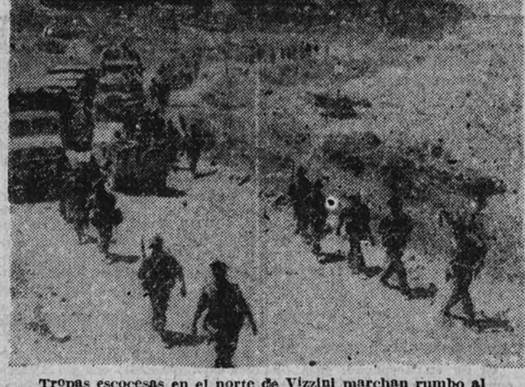
Tropas escocesas en el norte de Vizitil marchan rumbo al frente de Catania.

LONDRES 5.—Radio Argel declaró esta noche que en el norte de Sicilia las fuerzas del Eje (Continúa en tercera página.)