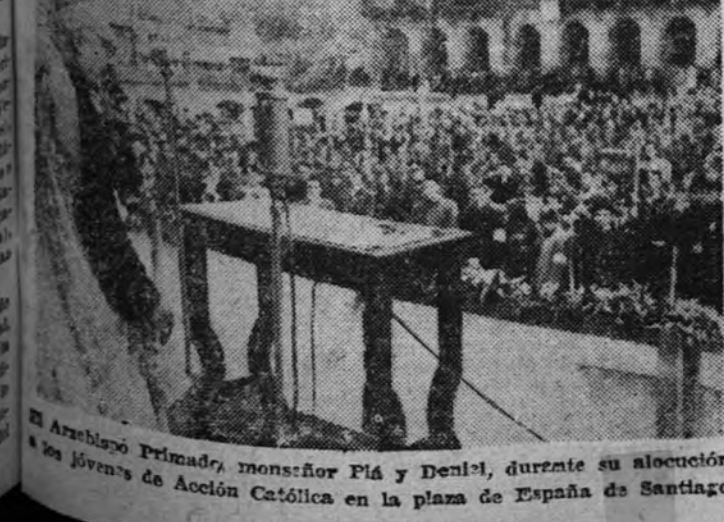
El Arzobispo Primado, monseñor Plá y Denís, durante su alocución a los jóvenes de Acción Católica en la plaza de España de Santiago.