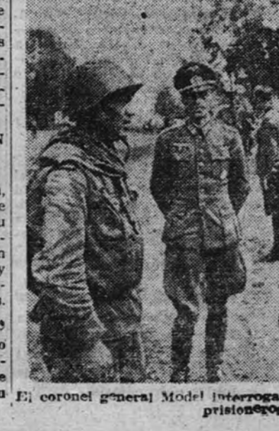
El coronel general Model interroga en el frente del Este a uno de sus prisioneros soviéticos.