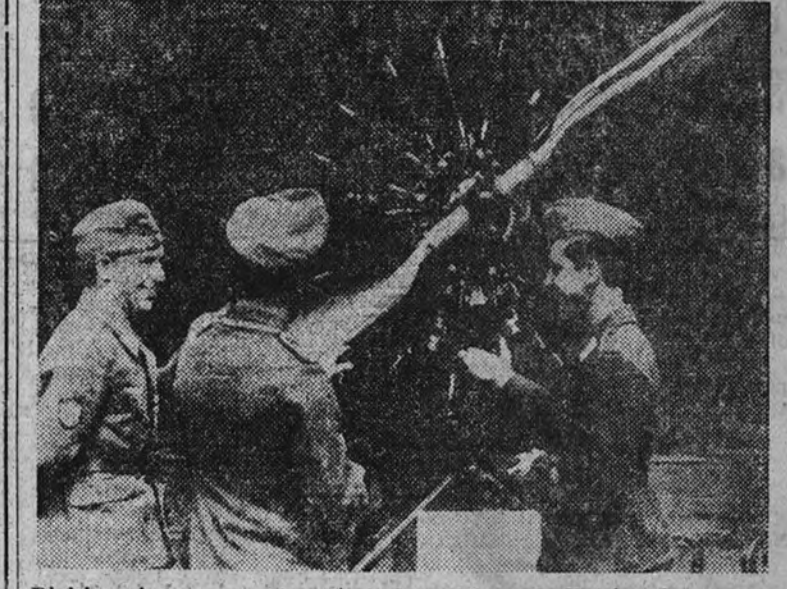
Divisionarios, que se encuentran de regreso a la Patria, al pasar por la capital del Reich visitaron una Exposición de material de guerra, en la que figuraban motores de Aviación, e interesados por los progresos del arma aérea, escuchan atentamente las explicaciones de los técnicos alemanes.