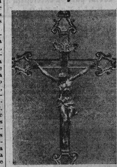
El Crucifijo de Bernini

Los últimos estudios acabados por pocos días permitieron al profesor Roberto Battaglia—ilustre estudioso italiano de temas artísticos—asegurar que los famosos veinticinco Crucifijos de la Basílica Vaticana son obras de Juan