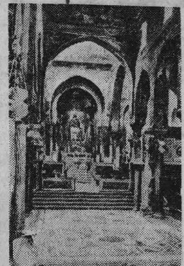
Vista interior de la Capota Palatina en Palermo

Hay, cuando la guerra surca sus aguas y pisa sus campos, está más cerca que nunca de los dioses, dul- ces, regala de la antigua miel griega, na- tural de las estancias de campos destruidos y florecidos, recostada en el terciopelo de un mar azul que polvorea de un sol que polvorea de una luz que polvorea de una vida que polvorea de una esperanza que polvorea de una fe que polvorea de una caridad que polvorea de una paz que polvorea de una armonía que polvorea de una belleza que polvorea de una verdad que polvorea de una justicia que polvorea de una libertad que polvorea de una fraternidad que polvorea de una humanidad que polvorea de una vida que polvorea de una esperanza que polvorea de una fe que polvorea de una caridad que polvorea de una paz que polvorea de una armonía que polvorea de una belleza que polvorea de una verdad que polvorea de una justicia que polvorea de una libertad que polvorea de una fraternidad que polvorea de una humanidad que polvorea