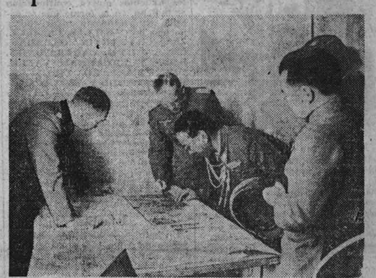
L. agregado militar japonés en Berlín, general mayor Komoto, visita las oficinas del Estado Mayor de uno de los sectores en lucha