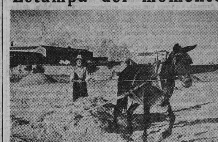
Cae la tarde y hay que recoger la parva, trillada en horas agobiantes de calor y de sol. El tablón que arrastra la mula forma, poco a poco, el montón que esperará un viento favorable, o será tragado, a paletadas, por las tolvas de las avellanadoras. De noche, en la madrugada, aun con estrías, carros repletos de miesa llegarán a las áreas para formar las nuevas parvas destinadas a la labor de los trillos.