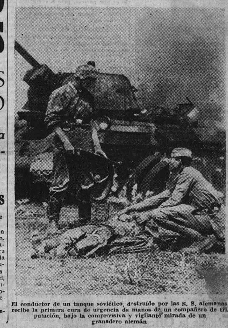
El conductor de un tanque soviético, destruido por las S. S. alemanas, recibe la primera cura de urgencia de manos de un compañero de trinchera, bajo la compresiva y vigilante mirada de un granadero alemán.