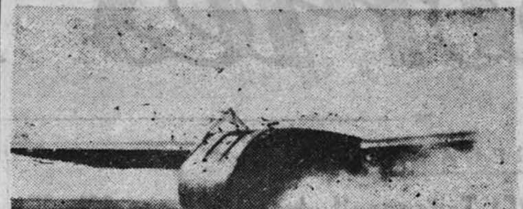
Las tropas americanas se entrenan para desembarcar de aviones veleros y entrar rápidamente en acción; nuestra foto muestra un fusilero yanqui desembarcando de un planeador y ya en posición de combate

Muebendorf y la otra, a las 14 horas, en Wetzendorf, en el cantón de Berna. Las dotaciones—diez hombres por cada aparato—han sido internadas. (Efe.)