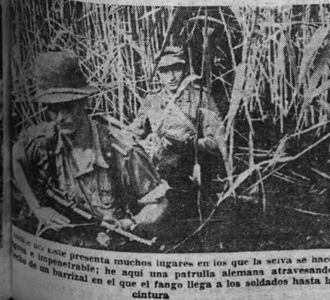
Este presenta muchos lugares en los que la seiva se hace espesa e impenetrable; he aquí una patrulla alemana atravesando un barrizal en el que el fango llega a los soldados hasta la cintura.