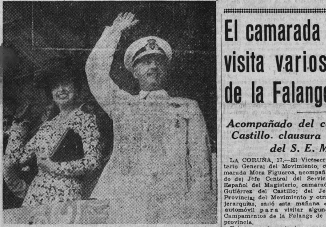
Dois notas gráficas de la solemne jornada marinera de Marín: el jefe del Estado pasa revista a la Flota concentrada en la ría desde una lancha rápida.—El jefe del Estado, acompañado de su esposa, corresponde a las aclamaciones del público en la plaza de toros de Pontevedra