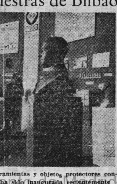
Una sala de la Exposición de herramientas y objetos protectores contra accidentes del ferrocarril que ha sido inaugurada recientemente