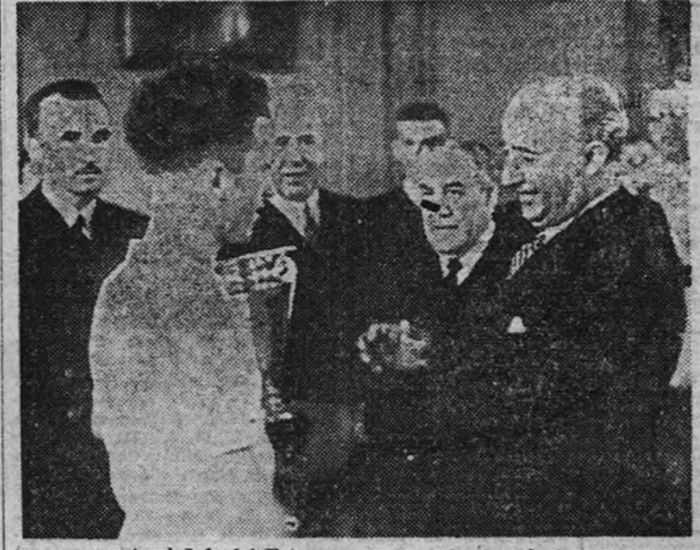
El Jefe del Estado entrega en La Coruña el trofeo de su nombre al patrón de la trainera ganadora de la regata de honor.