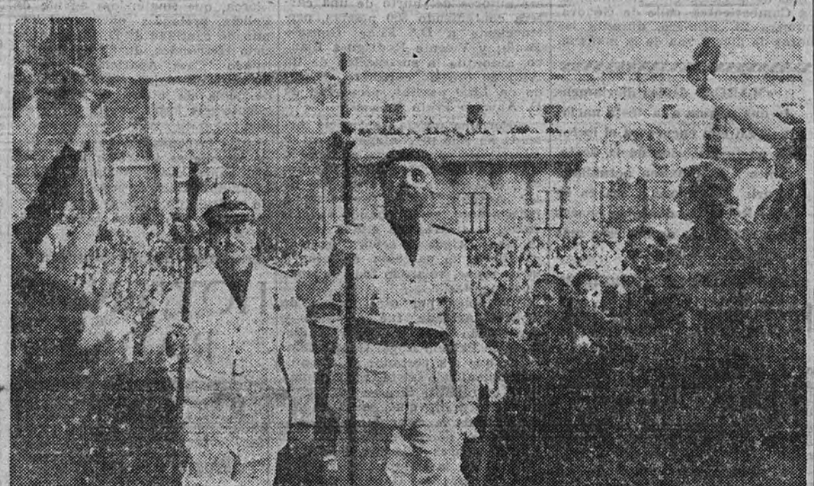
El Caudillo, acompañado del Ministro Secretario, camarada Arrese, sube a la catedral de Santiago, al frente de la peregrinación nacional de la Falange, entre fervorosas aclamaciones del pueblo compostelano.

SANTIAGO DE COMPOSTELA 23.—Hoy la ciudad de Santiago de Compostela ha vivido la más grande de sus peregrinaciones jubilares. Era la Falange de España la que se acercaba a los pies del «Hijo del Trueno» para ofrecerle el homenaje de su fe y la ofrenda de su piedad religiosa. Franco, Caudillo de España y Jefe Nacional de Falange, peregrino de esta magna romería de fe española, ha presidido la solemnidad. Era la Falange, y por consiguiente era el latido de España quien se acercaba a los pies del Amigo del Señor para expresarle el sentimiento católico del Movimiento. Profunda religiosidad la de los miles de Españoles llegados de las distintas provincias españolas, que ha conmovido a la ciudad de piedras milenarias para hacerla vivir la más grandiosa jornada de fe.