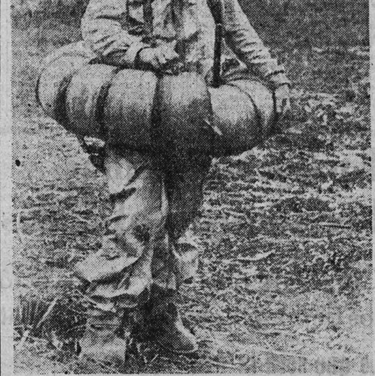
En el sector del Kuban los grupos de asalto soviéticos atacaron, con trajes impermeables y flotadores de nuevo modelo, las posiciones alemanas; este prisionero llevaba uno de dichos trajes

BERLIN 24. (Servicio exclusivo de correspondencia de ARRIBA).—La tercera vez los alemanes han evacuado Karkov tras las violentas batallas desencadenadas en esta ciudad. Karkov ha sido disputado por los alemanes desde el primer día de batalla. Karkov ha sido evacuado y ha sobrado tiempo para destruir previamente cuantas instalaciones militares pudieran haber sido destruidas. Los comentarios alemanes no han variado respecto a la opinión formada sobre el frente Este. Los alemanes no consiguen perforar nuestras líneas—se nos ha dicho—. Una línea importante puede tener relevancia estratégica; es de esperar que los alemanes no aspiran a mantener intactas sus posiciones, como se ha visto en la batalla de Karkov, donde numerosas y bien dotadas unidades de la Wehrmacht, pero que no se han podido salvar, han sido destruidas. En la batalla de Karkov, el mismo hoy que ayer, se ha producido una batalla absoluta. «Es verdad que atacan en el frente del Este trescientas divisiones, pero en este caso serían trescientas divisiones nominales. De ellas, a estas alturas, algunas no tienen más que un regimiento o poco más. Trescientas divisiones con cinco millones de hombres aproximadamente. Que estudien ellos preparados para empujar el ataque es más posible, pero que sigan combatiendo hoy no tiene nada de verosímil.