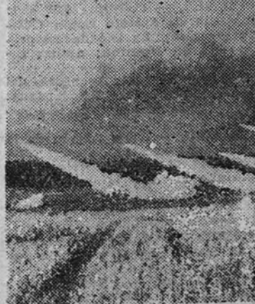
Vision de la manera de actuar de las unidades alemanas en el frente del Este