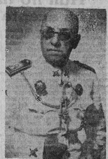
Excelentísimo señor don José Moscardó, Delegado Nacional de Deportes de Falange Española Tradicionalista y de las J. O. N. S. Presidente del Comité Ejecutivo del Congreso