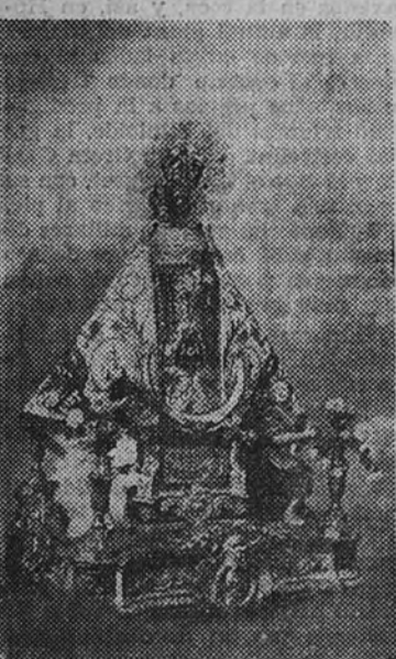
Nuestra Señora de las Virtudes, Patrona de Villena.

Villena.—Lo hemos dicho ya en otra ocasión—se escapa de la región valenciana. Situada en la conjunción geográfica de las provincias de Alicante y Valencia con las de Albacete y Murcia, mira hacia estas últimas en un afán de alzarse sobre los riscos del castillo secular que la corona y otear la llanura, y tras ella, la meseta de Castilla. Villena es fundamentalmente castellana, y aun empujándola como está de pueblos hondamente valencianos—Biar, Benjama, Castalla, Onil, Alcoy, etc.—, ha sabido conservar a través de las edades esta su etnología peculiar. Su lenguaje, sus costumbres racionales, su tradición con castellanías más levantis, y sólo conserva en el marco de ésta una nota en sus fiestas populares: las comparsas de moros y cristianos en un debelar de pólvora que recuerda a Valencia.