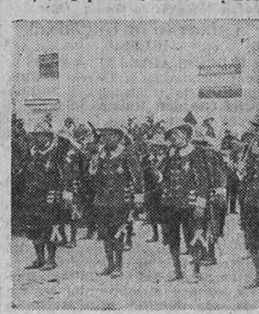
Una de las comparsas de cristianos.

Es imposible reproducir en palabras la grandiosa emotiva de ese momento en que nuestra Virgen, pausada y solememente, avanza sobre las cabezas de los que enroscaron vitorandola a lo largo del camino. El pueblo entero—no hay hiperbole en esta afirmación—ha congreñado allí para darle la bienvenida, acto de una solemnidad extraordinaria y de una imponente grandeza. El último