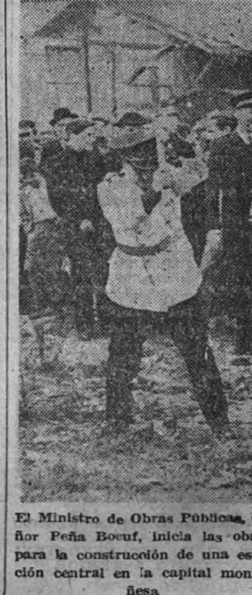
El Ministro de Obras Públicas, señor Peña Bouf, inicia las obras para la construcción de una estación central en la capital montañesa