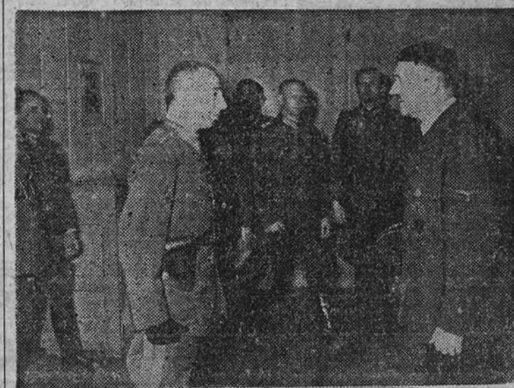
El coronel general von Csaty, de Hungría, es recibido en su Cuartel general por el Canciller del Reich