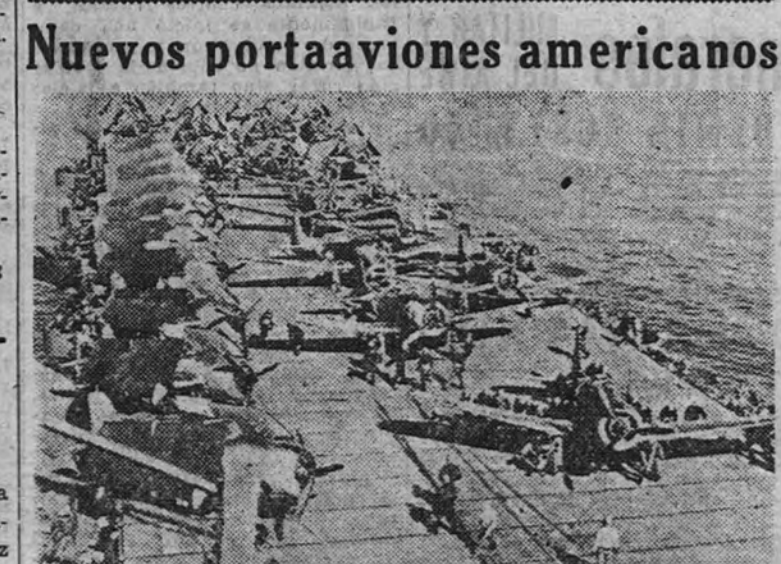
Cazas "Wildcat", bombarderos "Dauntless" y torpederos "Avenger" cubren la cubierta de vuelo de uno de los más modernos portaaviones americanos, que aún de su transformación fue el "Cruz Rojo".

VIGO 27.—A última hora de la tarde llegó a esta ciudad el teniente general don Agustín Muñoz Grandes, jefe de la Casa Militar de Su Excelencia el Jefe del Estado. Fué recibido por las autoridades locales. (Cifra.)