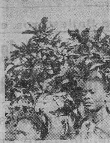
Un aspecto de la vespertina de la Guinea Española

tiempo de que se dispone para descargar el árbol de su fruto maduro y dar espacio para las nuevas floraciones del siguiente año, que se presenta simultáneamente a la cosecha que se recoge.