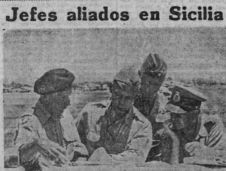
El general Montgomery, con los generales Alexander y Patton, durante el estudio de nuevos planes estratégicos, después de terminada la batalla de Sicilia.

El príncipe heredero subirá al trono como Rey Simeón II. (Efe.) PROCLAMA DE FILOFF. SOFIA 28.—La segunda proclamación del presidente Filoff al pueblo búlgaro decía así: «Búlgaros: Hoy, 28 de agosto de 1943, Su Alteza Real el Príncipe heredero Simeón de Tarnovo, amor y esperanza de Bulgaria, ha subido al trono bajo el nombre de Simeón II de Bulgaria, en virtud del artículo 34 de la Constitución. En virtud del art. 151 de la Constitución, el Consejo de Ministros asumirá la dirección de Bulgaria, hasta la reglamentación del problema de la Regencia.