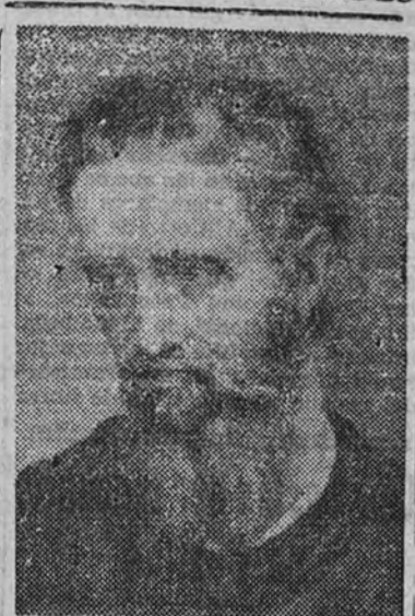
Miguel Ángel (retrato de autor anónimo)