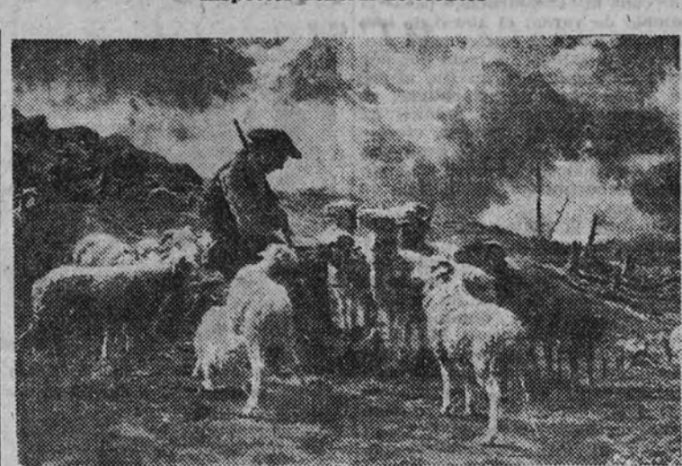
Triste autor de su propia ruina. El ganado parece reclamarle la falta de hierba, entre los restos del incendio que su inconsciencia provocó (Cuadro de R. Bonheur)

Entre las causas de destrucción que se hallan expuestas a las masas forestales, algunas señaladas ya desde estas columnas, ocupan preferente lugar en la época actual de calores estivales los incendios. La falta de humedad del suelo, la hierba agostada, el matorral reseco, el ambiente caliginoso con exigua o nula nubosidad, constituyen condiciones favorables para que se convierta en realidad el peligro de los incendios. Estos, que excepcionalmente pueden obedecer a causas fortuitas, como el rayo, aerolitos y combustión espontánea o producida por focos de calor a través de un trozo de vidrio como lente, se originan en la casi totalidad de los casos por la acción deliberada o imprudente de los hombres. La chispa despreñada del hogar de una locomotora, el cortocircuito producido en una línea de conducción eléctrica, el fuego que, sin consumir y apagar totalmente, abandonó cualquier excursionista en paraje muchas veces de los menos vigilados del bosque; la punta de cigarro o la cerilla arrojados descuidadamente, el tacho inflamado del cazador, los hornos o carbones mal emplazados y la quema de despojos son causas involuntarias que hay que sumar a los fuegos producidos por venganza y a los producidos al hacer el pastoreo con ánimo de aumentar la superficie destinada al pastoreo, cuando no por intereses madereros, ávidos de alcanzar a bajo precio los productos subastados del siniestro.