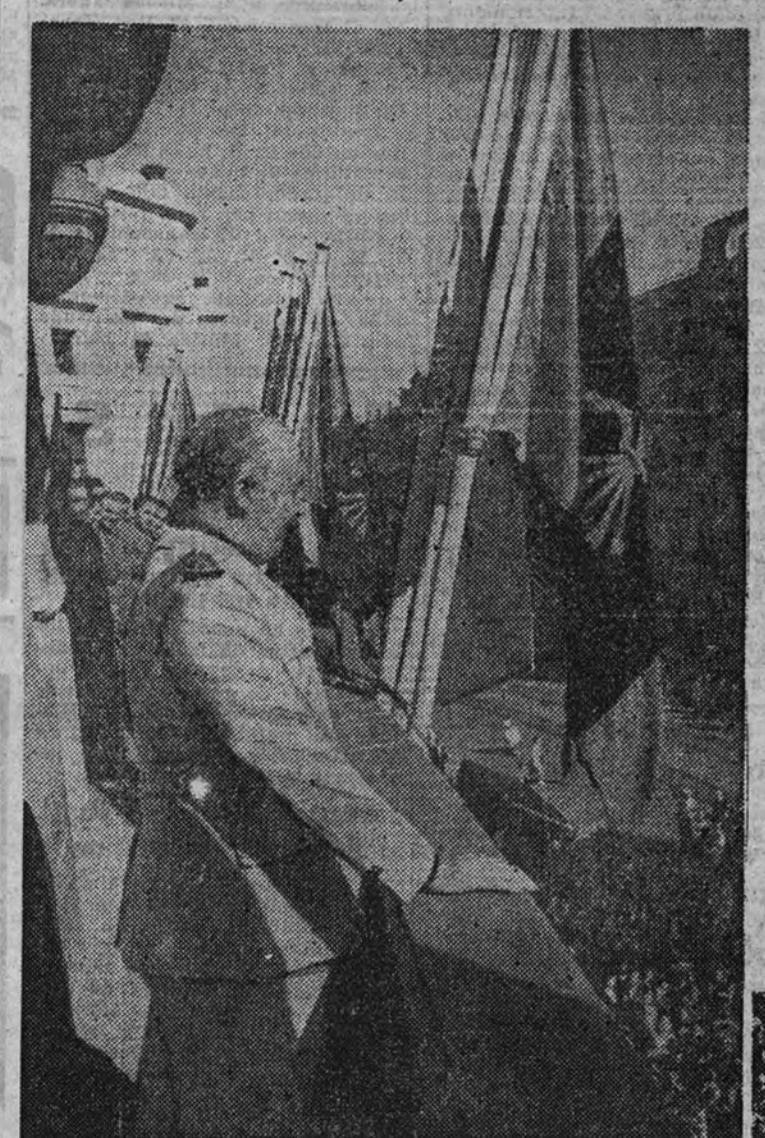
El pueblo en masa aclama clamorosamente al Caudillo en su último viaje a Lugo