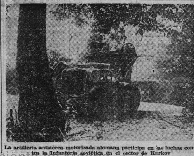
La artillería antiaérea motorizada alemana participa en las luchas contra la Infantería soviética en el sector de Karlov