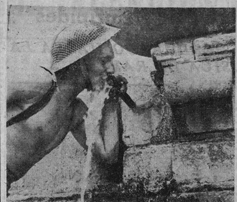
Un soldado británico en Sicilia apaga su sed bebiendo el agua de una fuente en una ciudad ocupada