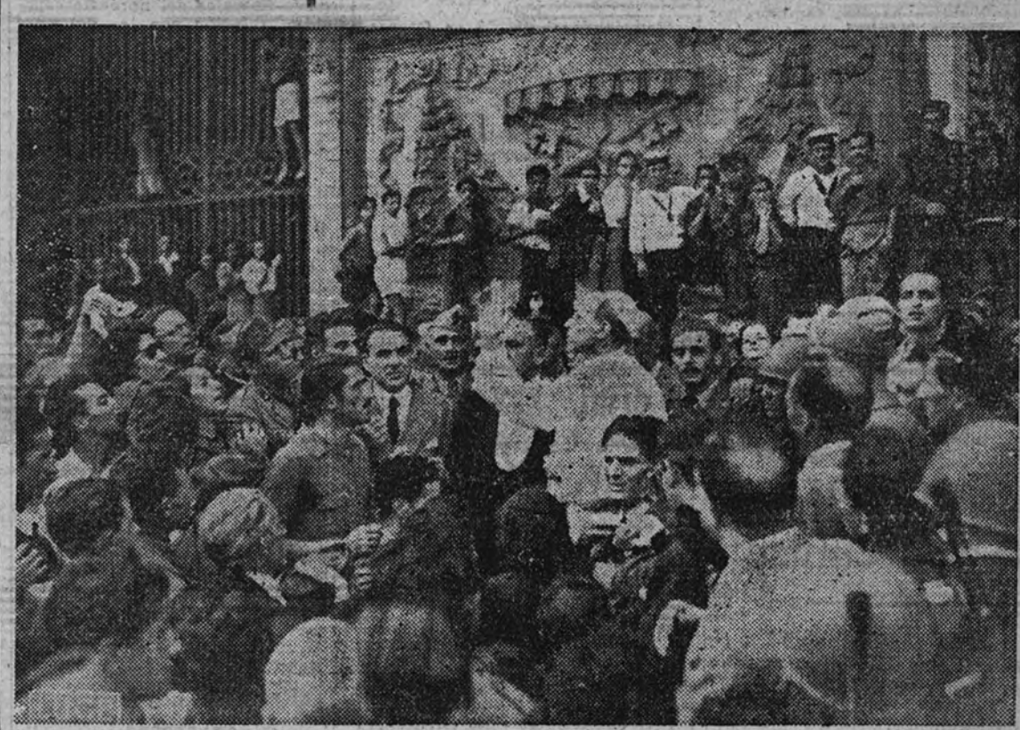
Su Santidad Pío XII bendice en la Basílica de San Juan a la población romana, poco después de una incursión aérea