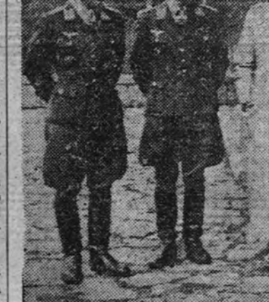
El mariscal del Reich, Goering, aparece en la foto rodeado de cuatro cazadores nocturnos, condecorados con las Hojas de Encina por su heroica labor.