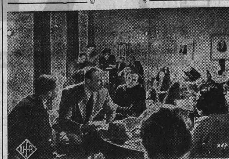
Una interesante escena de la película "Misterio en la marisma", que con caracteres de gran acontecimiento se proyectará el próximo lunes en el cine Palacio de la Prensa.