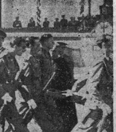
La fotografía recoge el momento de la jura de la bandera de los caballeros aspirantes a oficiales de Complemento, verificada en el campo de polo de La Granja. Al acto asistieron el jefe directo de la Milicia, teniente general Salguero, y otras altas autoridades militares.