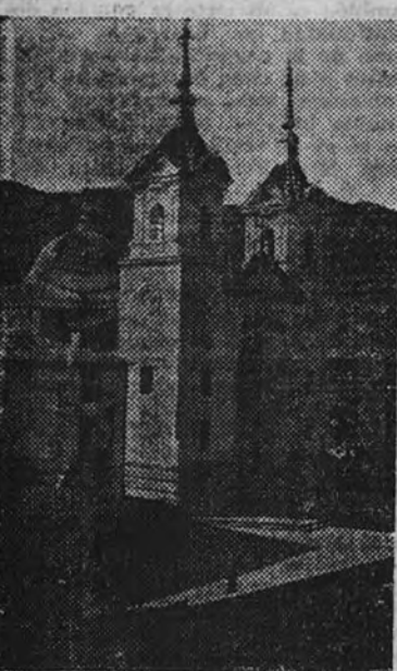
Santuario de Nuestra Señora de la Fuensanta.

Sobre los montes de la Fuensanta, y dominando la vega murciana, bajo su sol ardiente, el Santuario de la Virgen destaca su bella silueta en divina protección de este pueblo, a quien las aguas del Segura y sus aguas magníficas para las empresas comerciales e industriales han hecho uno de los más prósperos de España. Su capital, situada en el centro de la renombrada huerta, ha adquirido en estos últimos tiempos extraordinario realce y grandes mejoras gracias a la constante preocupación de su Excelentísimo Ayuntamiento, que con su celo en su afán de engrandecerla constantemente y ponerla a la altura que se merece por su importancia agrícola, industrial y artística.