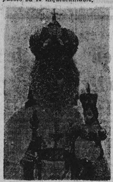
Nuestra Señora de la Fuensanta.

Es por ello que en estos días de feria la ciudad adquiere una fisonomía muy suya, pues la devoción de todo buen murciano por su Santa Patrona se desborda en funciones religiosas y fiestas diversas, y entre el ruido de los fuegos de artificio, que culminan con la gran romería al Santuario del Monte, en solitario y emotiva procesión, demuestran su Santísima Patrona la inmensa fe y afecto de los murcianos en ella. En esta romería la sagrada imagen es llevada a su santuario en medio de las aclamaciones y oraciones fervientes de todo el pueblo murciano, que adora a su Fuensanta, y que en ella la puso su fe inquebrantable.