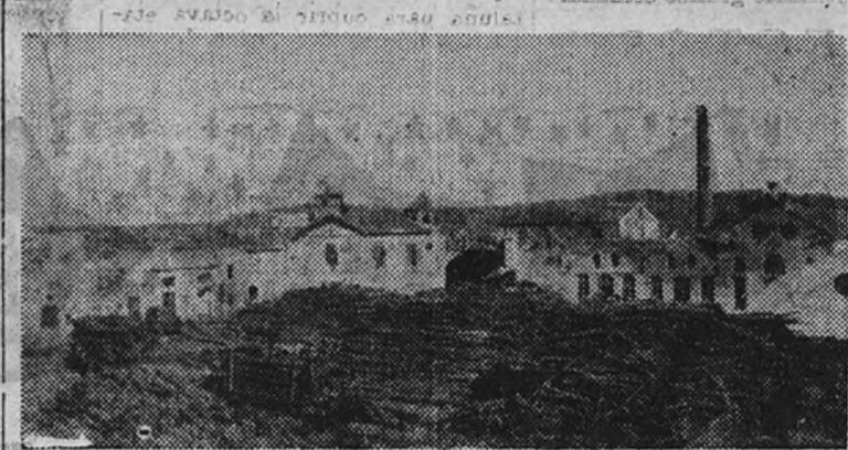
Vista de uno de los depósitos.

La industria maderera tiene su mejor representación en este pueblo, situado a siete kilómetros de la capital, en la carretera que la une a Granada, en donde los señores Galindo han instalado una fábrica dotada de los más modernos adelantos.