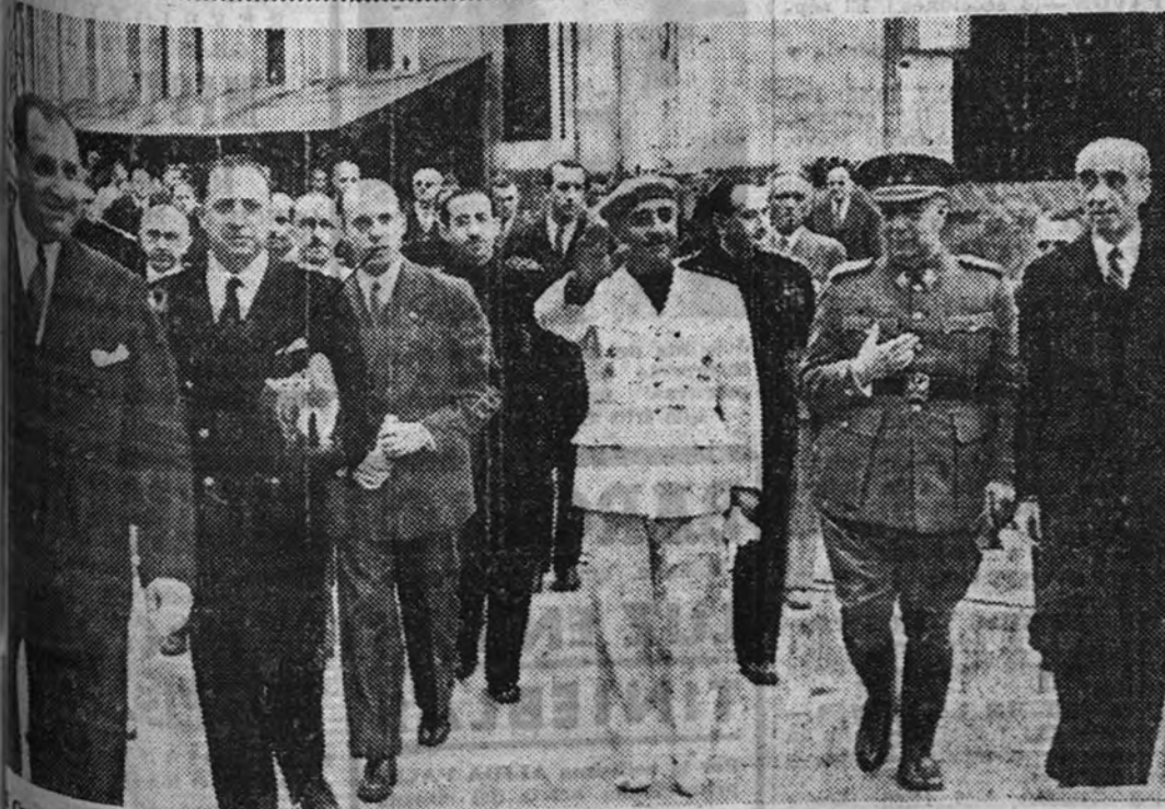
Caudillo, acompañado del Ministro Secretario General y otras jerarquías y autoridades, recorre las Fábricas Auxiliares de Ferrocarriles de Beasain

VIUDA DE TRABAJADOR: Tú y tus hijos tenéis también derecho a una pensión. Tal viene a ser el Subsidio de Viudedad y Orfandad que el Estado Nacionalindicalista te pagará mensualmente a tu difunto esposo figuró en el Subsidio Familiar.