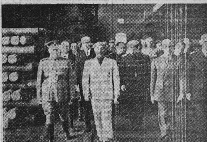
La visita a una de las dependencias de la fábrica